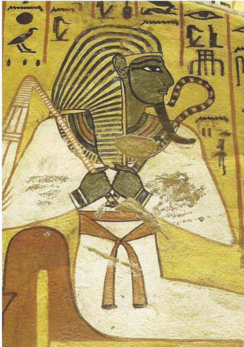
Hypogée de Pshedu.