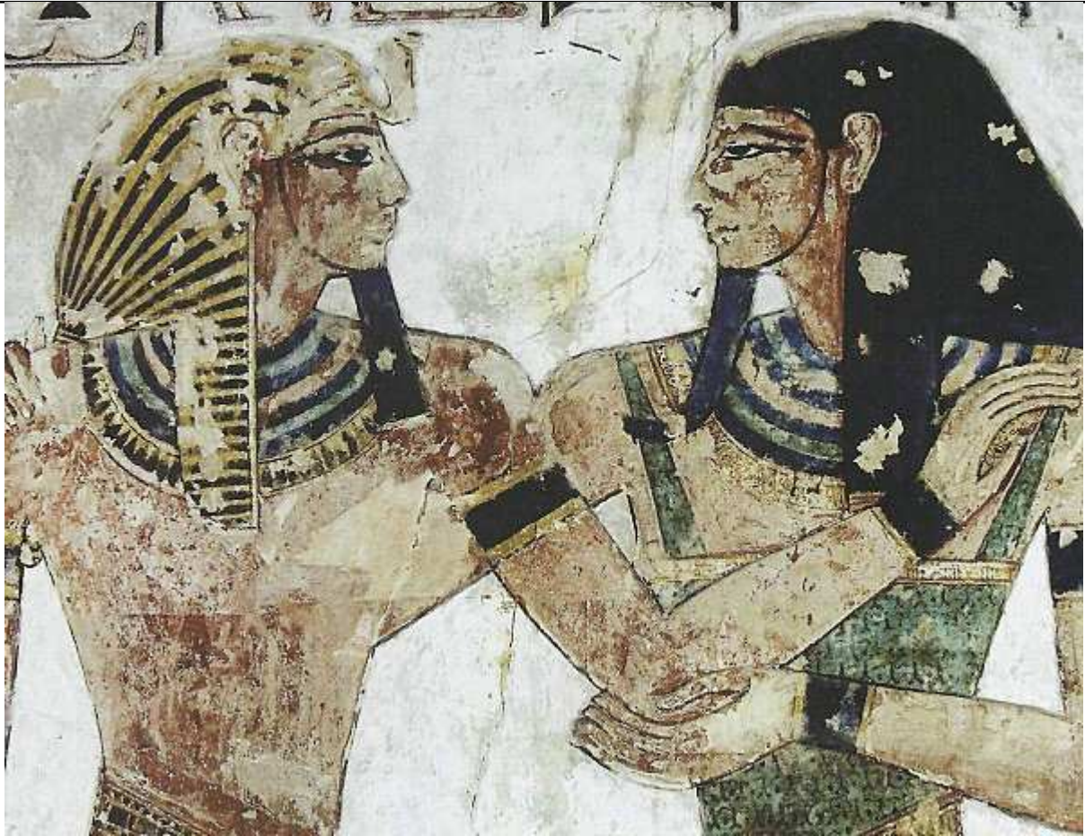
Hypogée de Sési I.