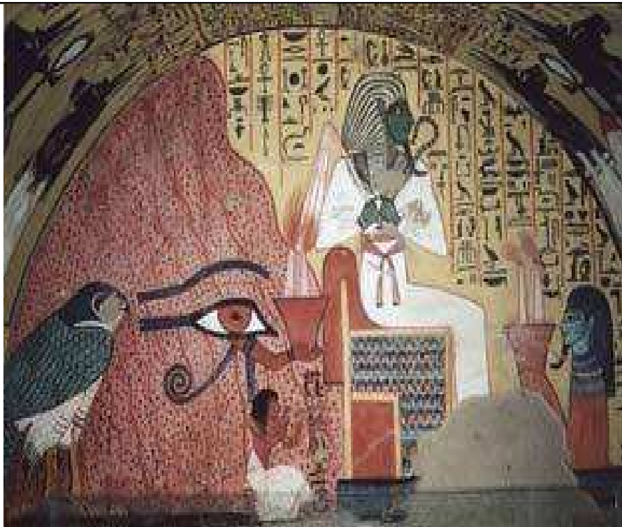
La tombe de Pached. La montagne à l'œil oudjat. Osiris sur son trône.