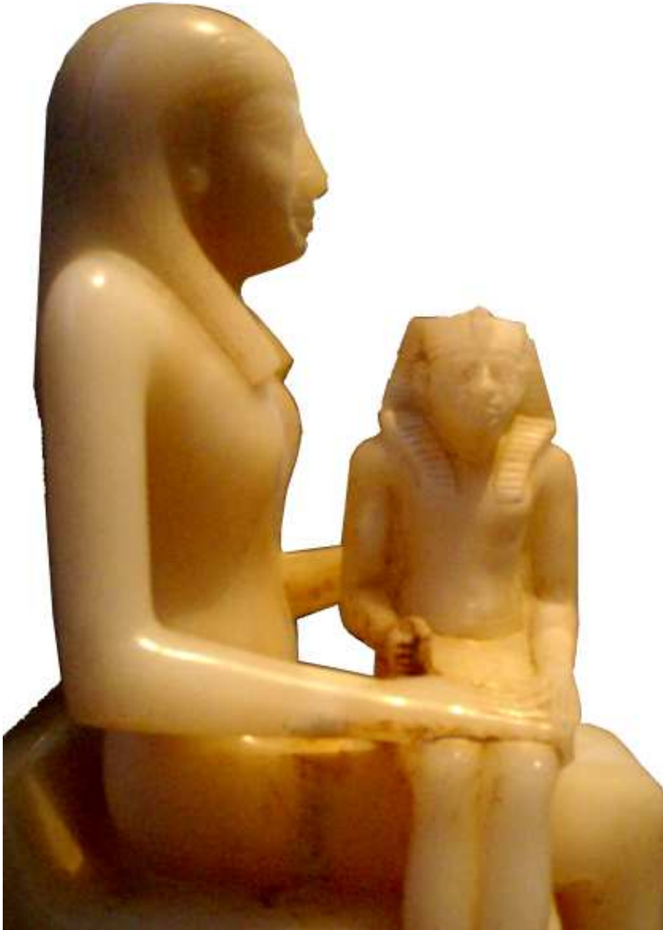
Statue en Albâtre de la reine Ankhnes-meryre II et de son fils Pépi II. 2 288 - 2 224 / 2 194 avant JC.