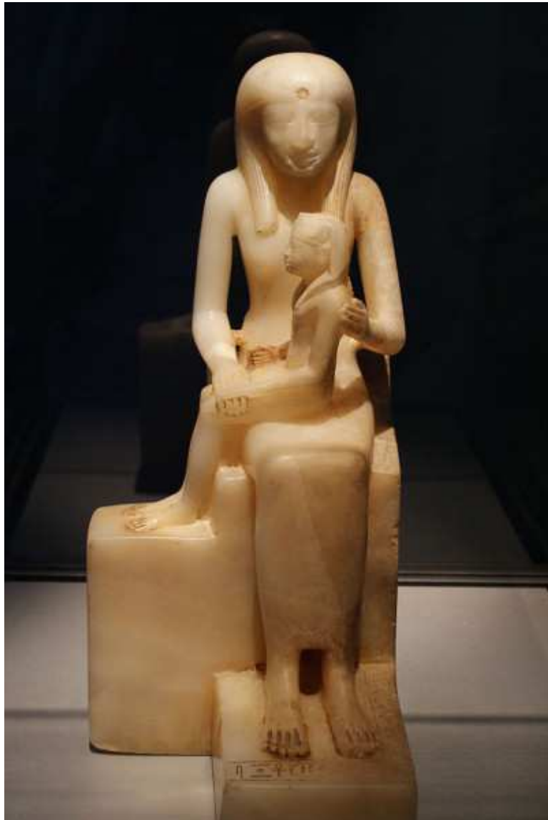
Brooklyn Museum... Charles Edwin Wilbour Fund, 39.119.