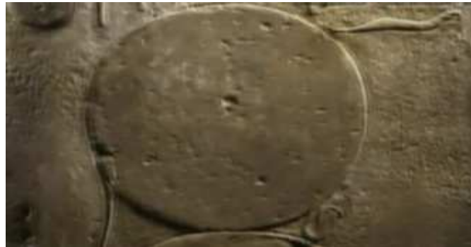
Disque solaire vivant...