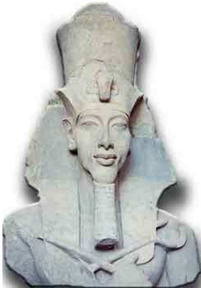
Colosse osirique à l'effigie du pharaon.