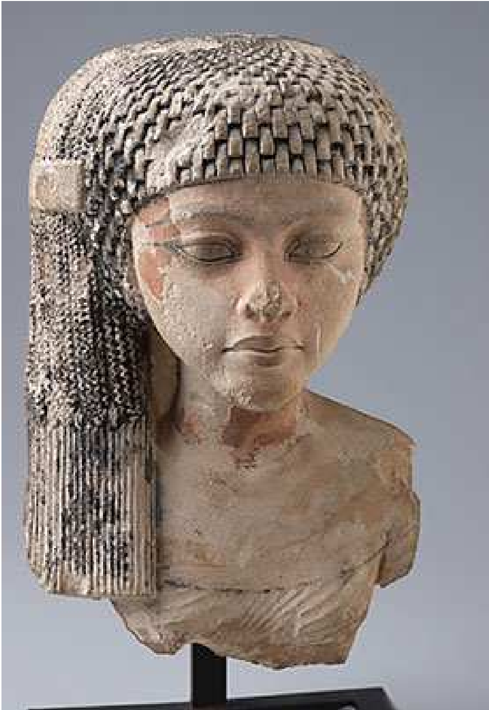
Une princesse de la famille d'Akhenaton.

→ Vers l'an 10 du règne, naîtra la dernière fille du couple amarnien, à savoir Setepenrê .