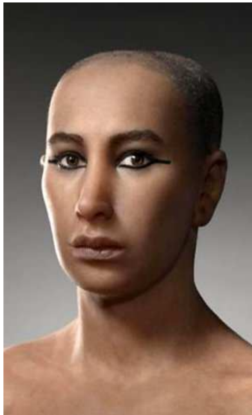
Un portrait de Toutânkhamon...

Voici donc, le visage probable de cet enfant-pharaon :