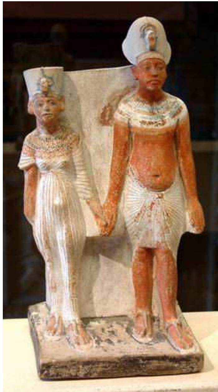
Statuette représentant Amenhotep IV et Néfertiti dans leur tendre jeunesse ! Musée du Louvre...