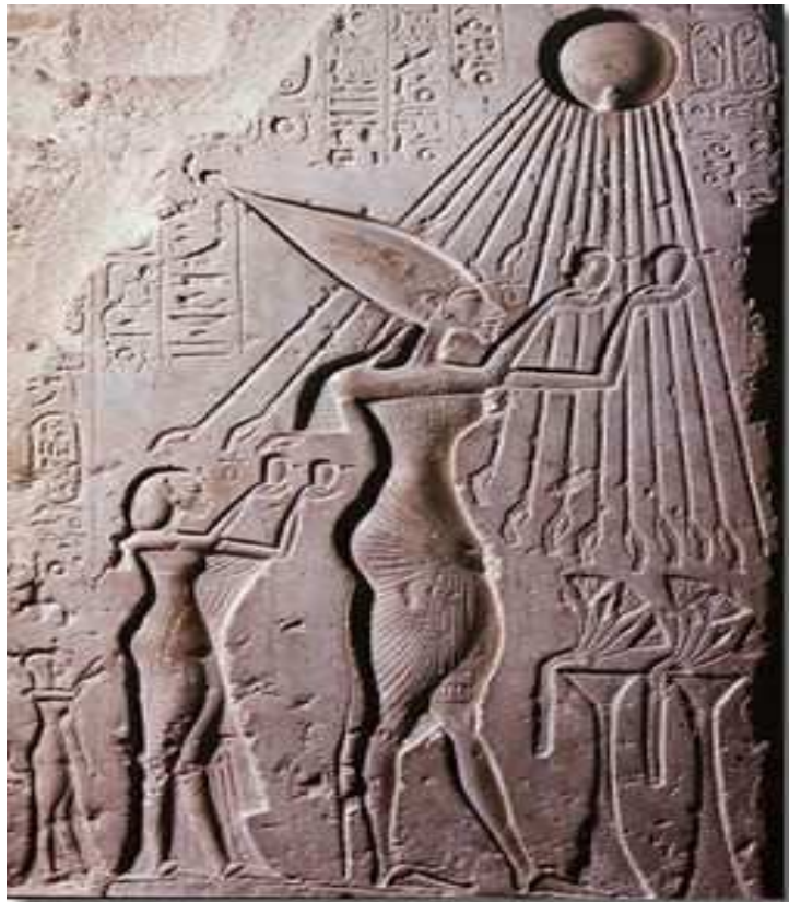
Bas-relief. Au musée du Caire.