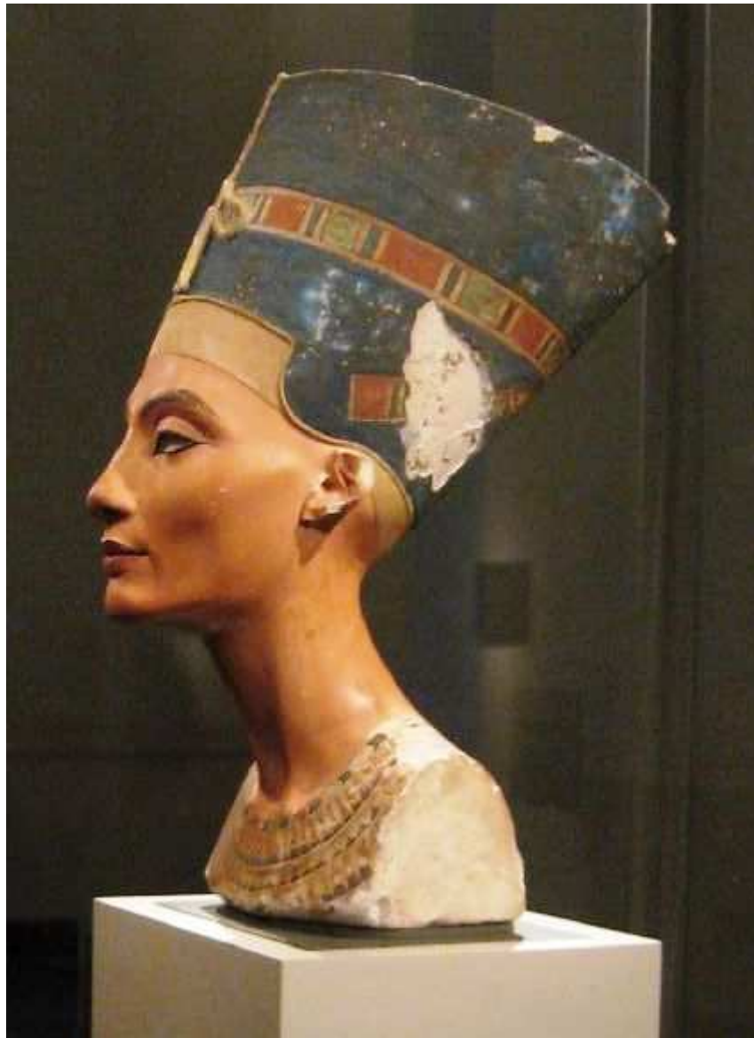
Côté gauche.

Le buste aurait subit une chute d'une hauteur d'un mètre cinquante ! D'ailleurs, comment cette hauteur à telle pu être déterminée ?