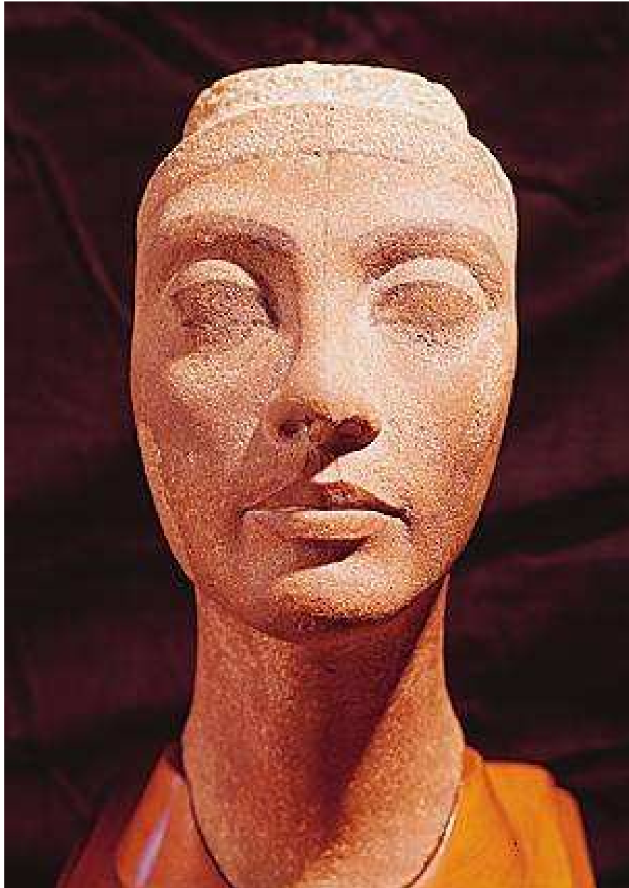
Tête inachevée en quartzite rose provenant de Tell al-Amarna. Musée de la Civilisation égyptienne. Le Caire.