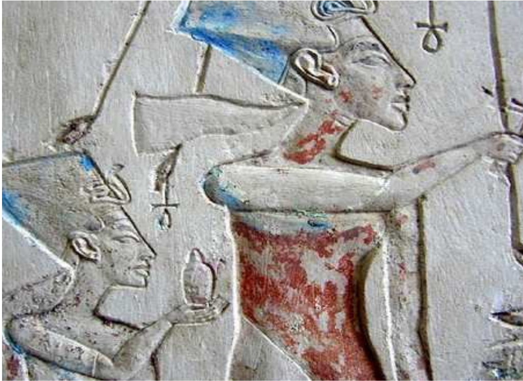
Akhenaton et Néfertiti officiant ensemble ! Musée du Caire.