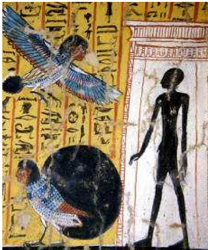
L'ombre de Nakhtamon sortant de son hypogée...