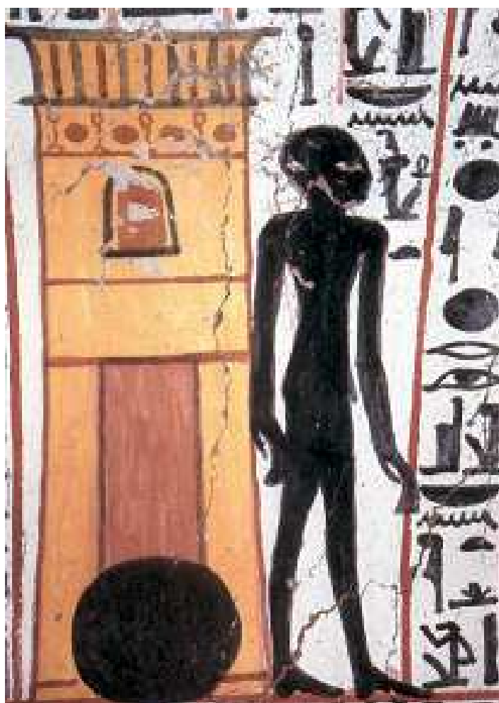
L'ombre de Nakhtamon sortant de son hypogée !