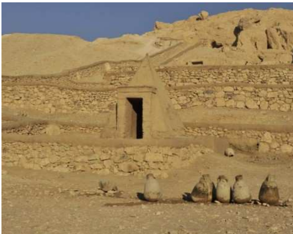
Voici l'entrée d'un des nombreux hypogées de Deir el-Medineh...