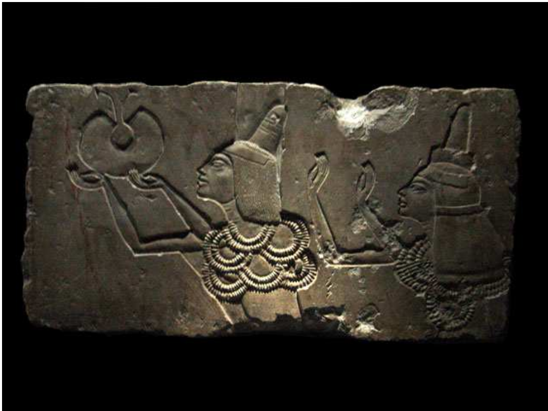
Le général Aÿ et son épouse reçoivent l'or de la récompense...