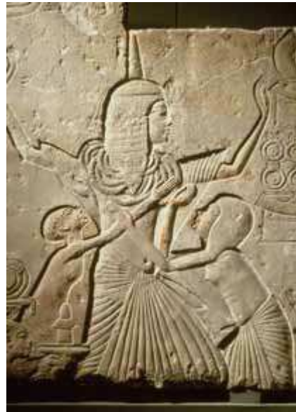
Le général Horemheb recevant "l'or de la récompense"...