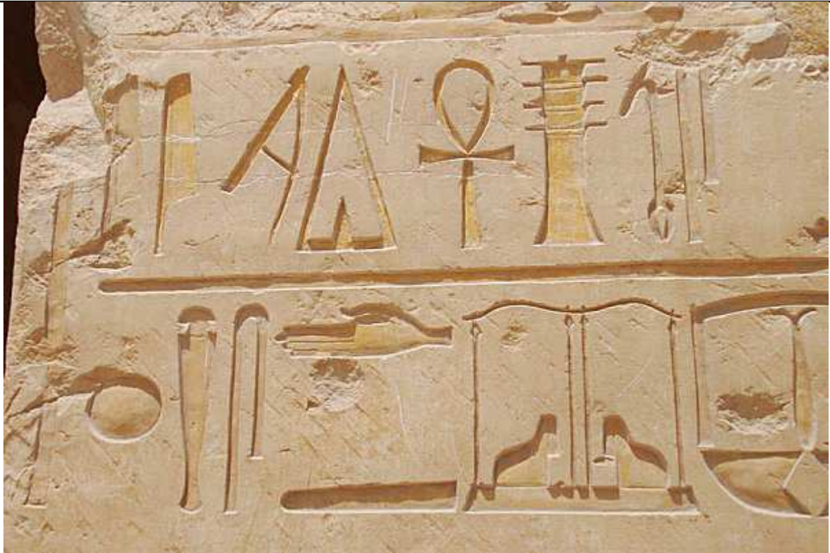
© Photo de Marie Grillot - Avril 2008 - L'ankh est le hiéroglyphe qui sert à écrire le mot vie.