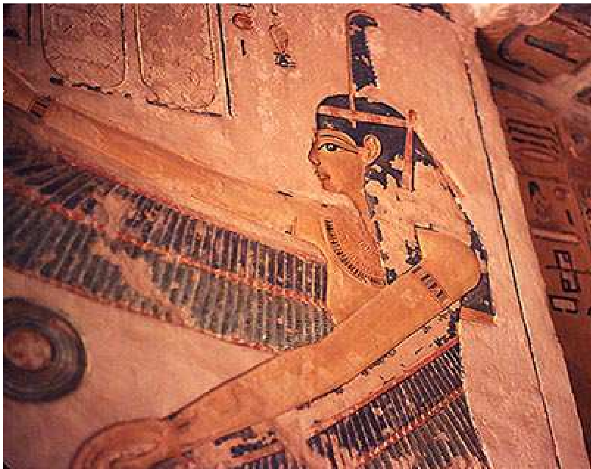
Dans un corridor de l'hypogée de Siptah. Pharaon de la 19e dynastie.

Maât est présente dans le cartouche de plusieurs pharaons !