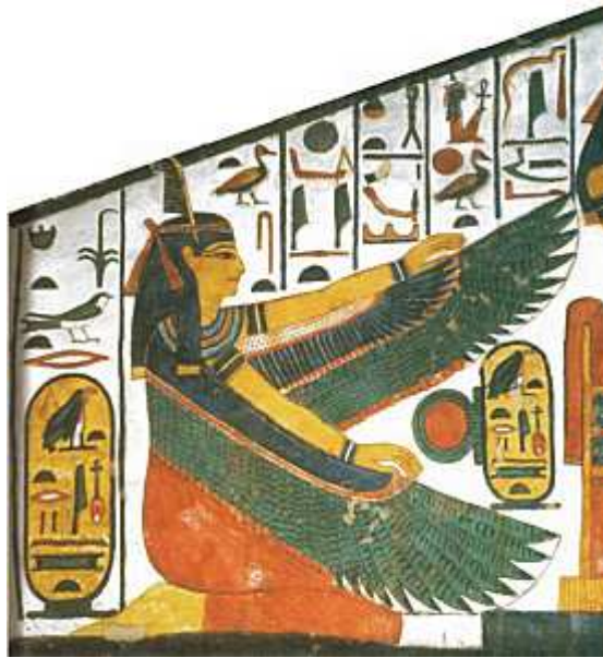
Maat with Nefertari Cartouche.

Davantage qu'une qualité... Davantage qu'un nètèr... Ce fut bien un principe !