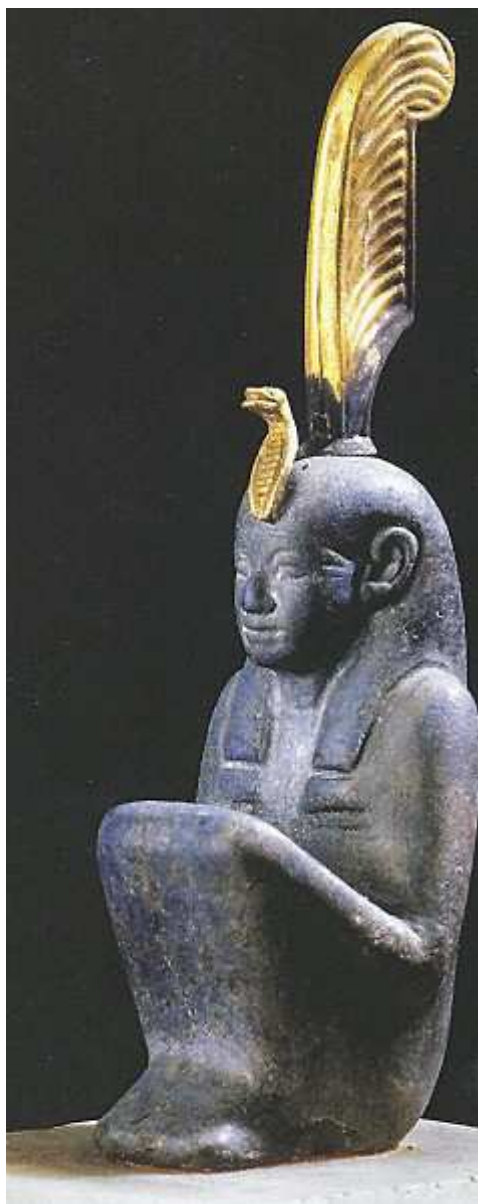
Statuette du nétèr Maât. Un uraeus... Une plume en or sur la tête... Le Caire.