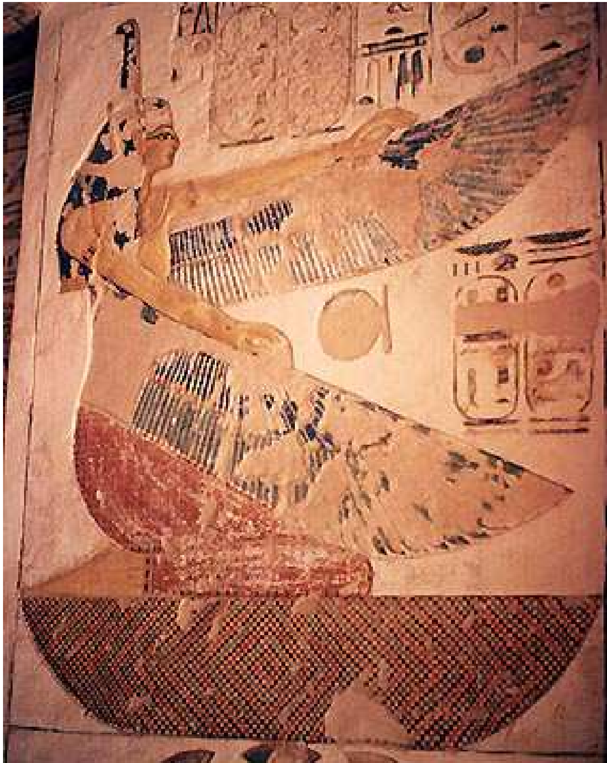
De l'hypogée de Siptah, pharaon de la 19e dynastie.