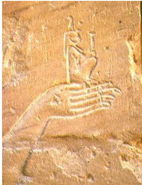
Temple de Dakka.