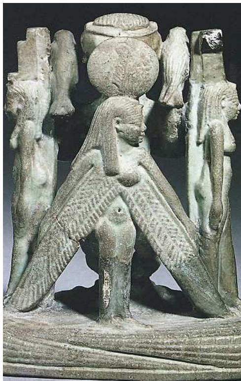
Figurine magique montrant Ptah entouré d' Isis et de Nephthys . Au premier plan le nètèr Maât ptérophore . Faïence de la basse Époque. Louvre.

Dans l'entrée de la salle du sanctuaire, le pharaon offrait la Maât (ntrt). Personnification de l'ordre universel et de l'équilibre cosmique. Elle est toujours reconnaissable à sa plume d'autruche !