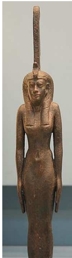
Statuette en bronze de Maât !