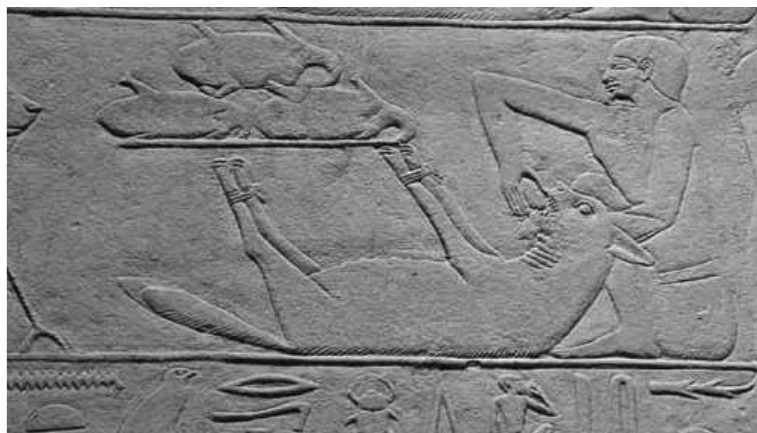
Gavage des hyènes !