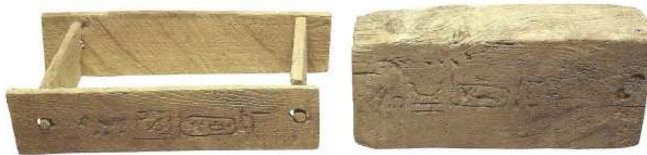
Moule à brique et sa brique... 28e dynastie.