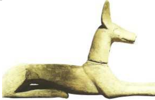
Époque tardive. Bois de sycomore. British Museum.