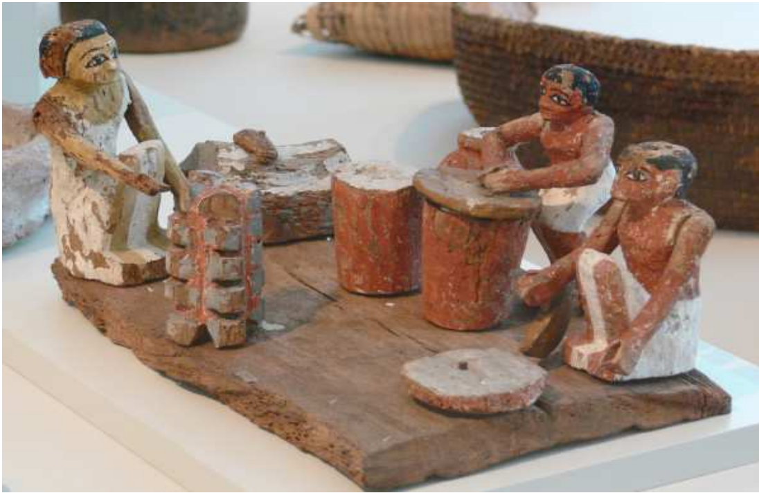
Modèle en bois d'une cuisine ! 12e dynastie. Ägyptisches Museum de Berlin