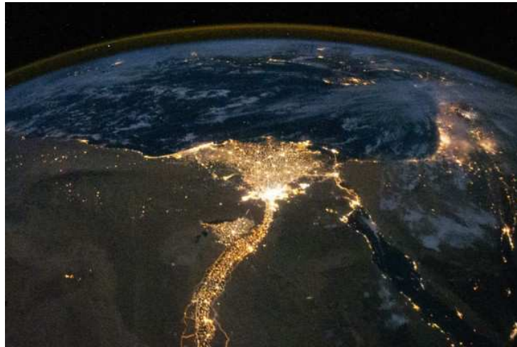
Egypt at night from the International Space Station in 2010.