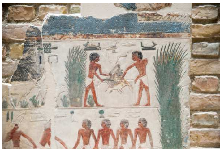
Neues Museum de Berlin... Temple du Soleil Niuserre !