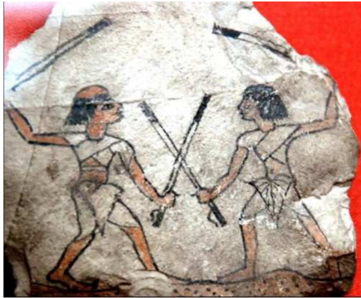
Ostracon depicting an Egyptian martial art tradition "The Tahtib" New Kingdom Ramesside Period 1300 BC Musée du Louvre E 25340.