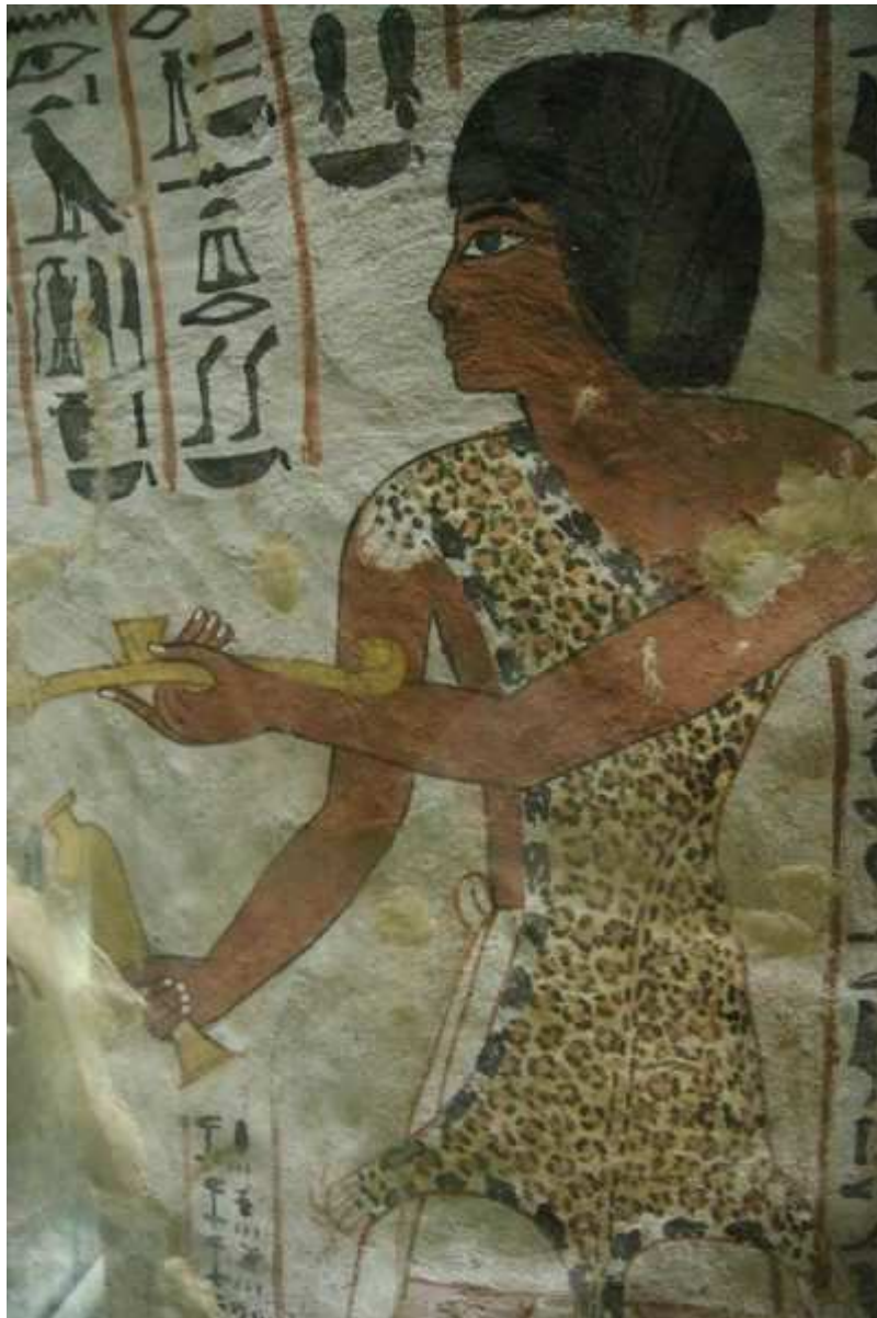
Voici une superbe photo d'un prêtre-sem... Provenant de l'ypogée de Sennefer !