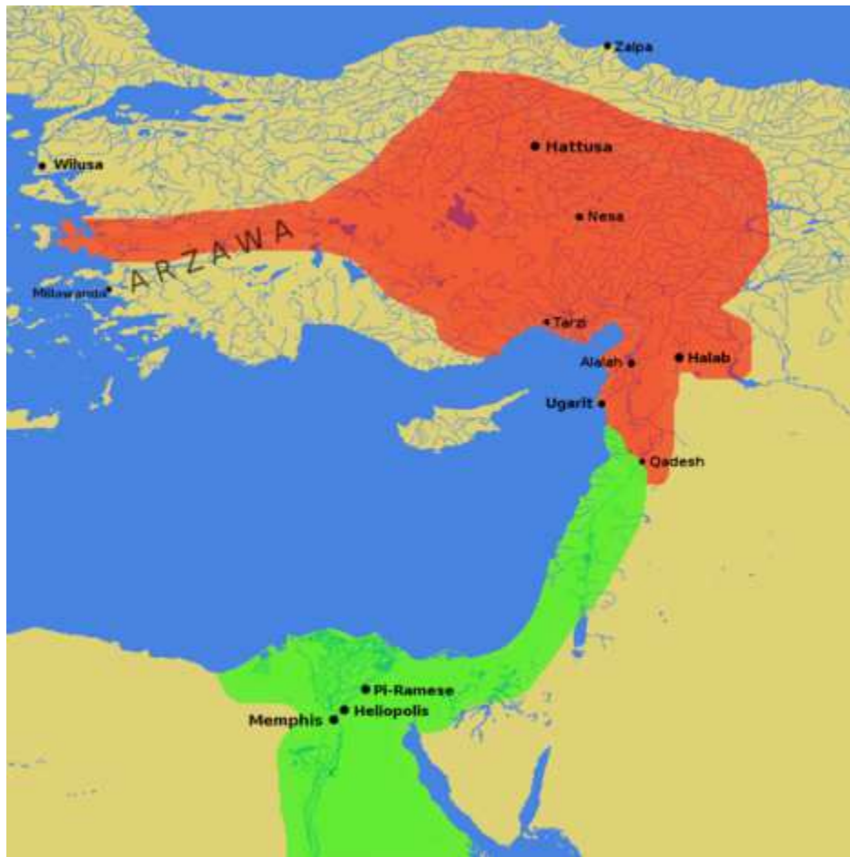
Kemet au temps des Ramessides !