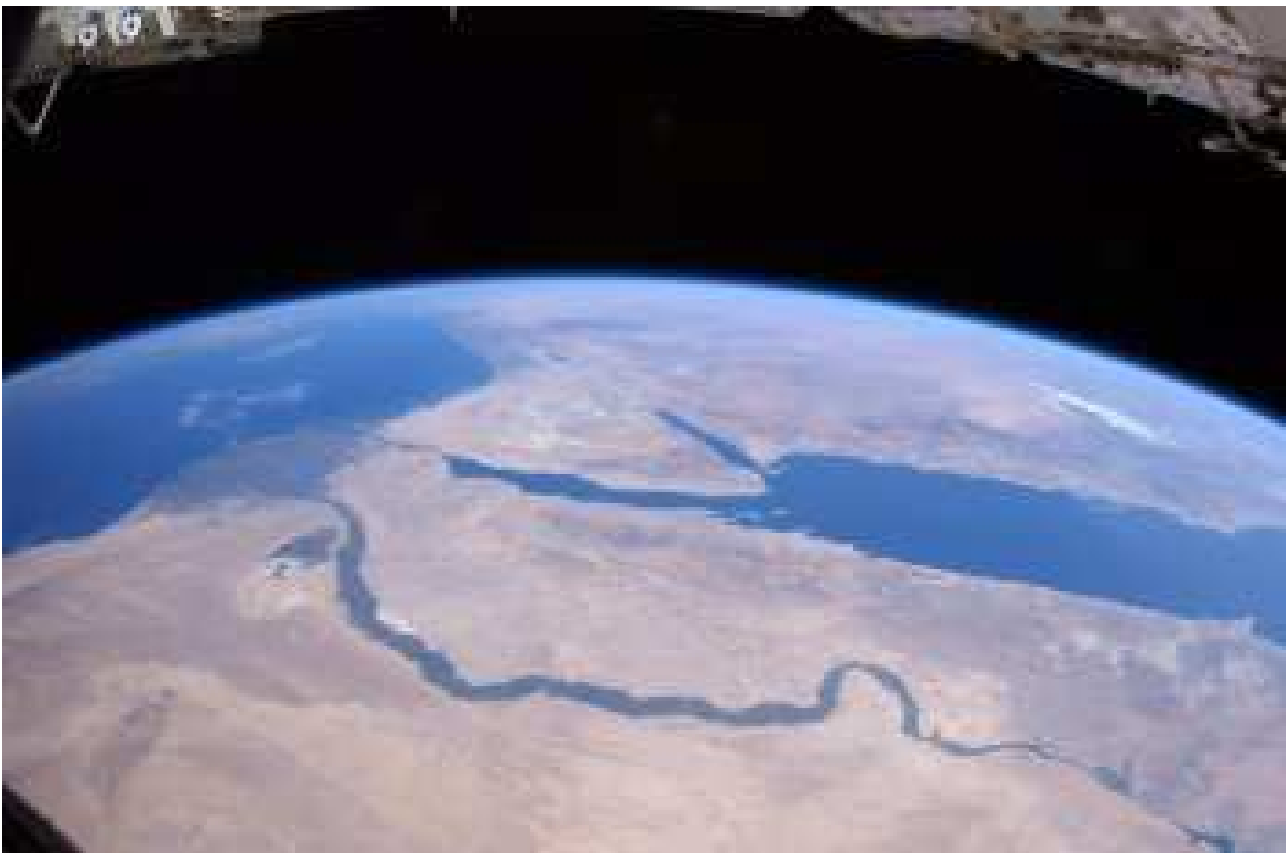
Le Nil vue du ciel...