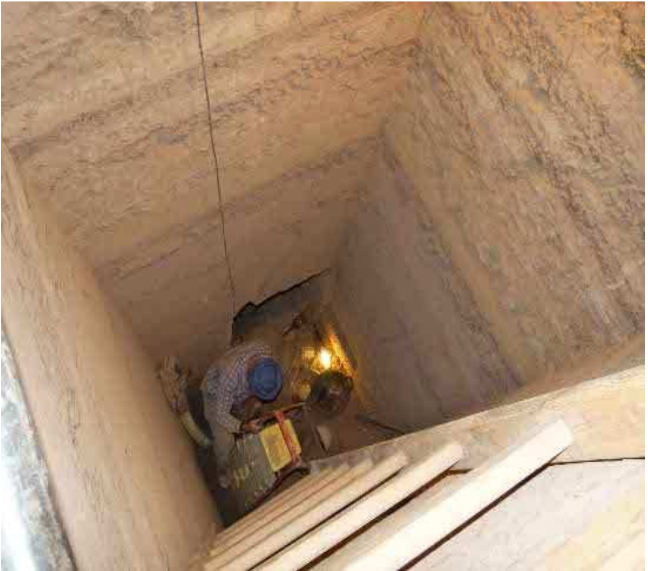
L'anthropologue Miguel Botella... Au sein d'un hypogée creusé dans la roche !