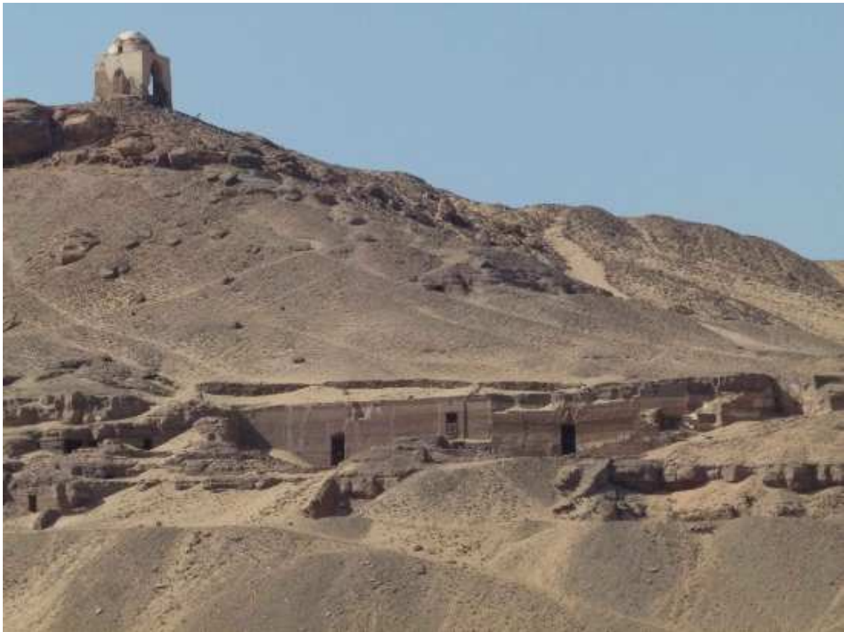
Vue de l'entrée des différents hypogées dans la nécropole de Qubbet el-Hawa...