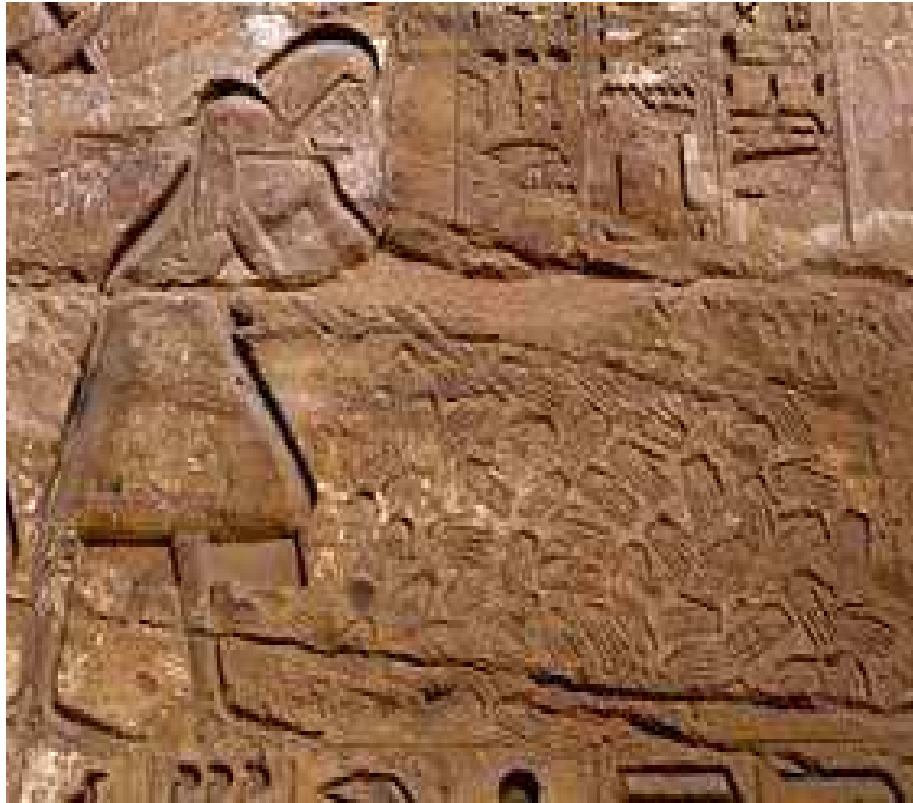
Ramses III. Medineh Abou.