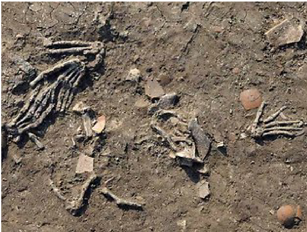
Several severed hands uncovered in a pit at Tell el-Daba !