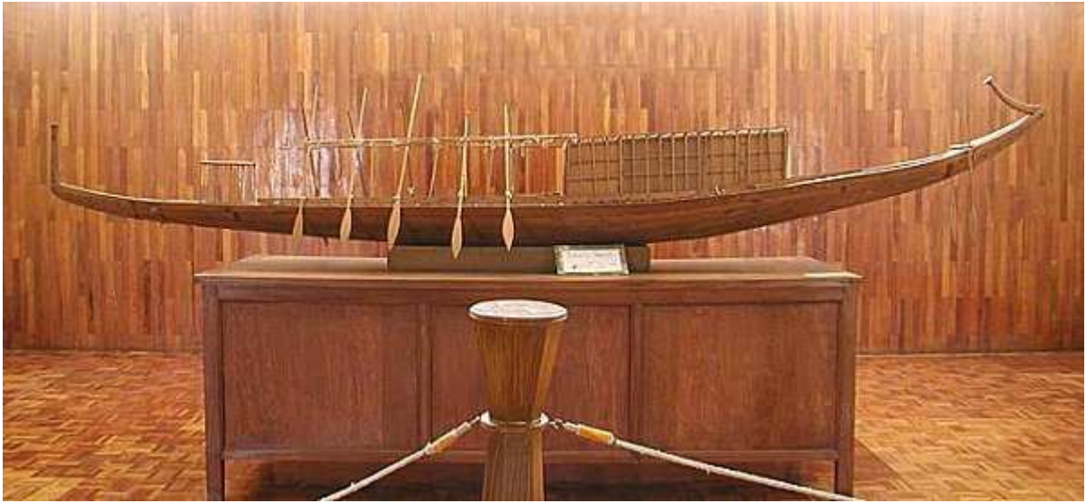
Maquette de la barque de Khéops découverte et reconstituée.

Rê inonde la terre d'Égypte de ses bienfaits de par ses rayons lumineux et chaleureux !