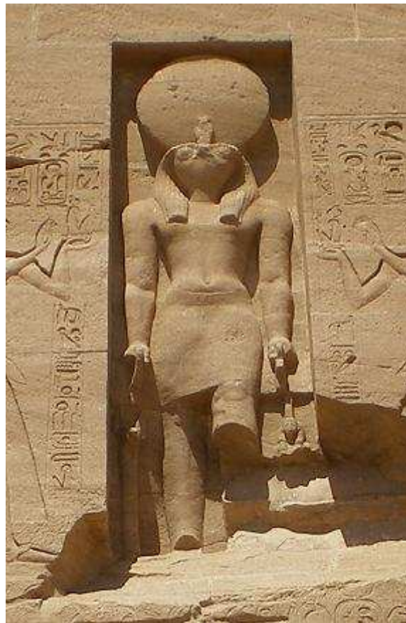
RÊ temple d'Abou Simbel !

Rê inonde la terre d'Égypte de ses bienfaits de par ses rayons lumineux et chaleureux !