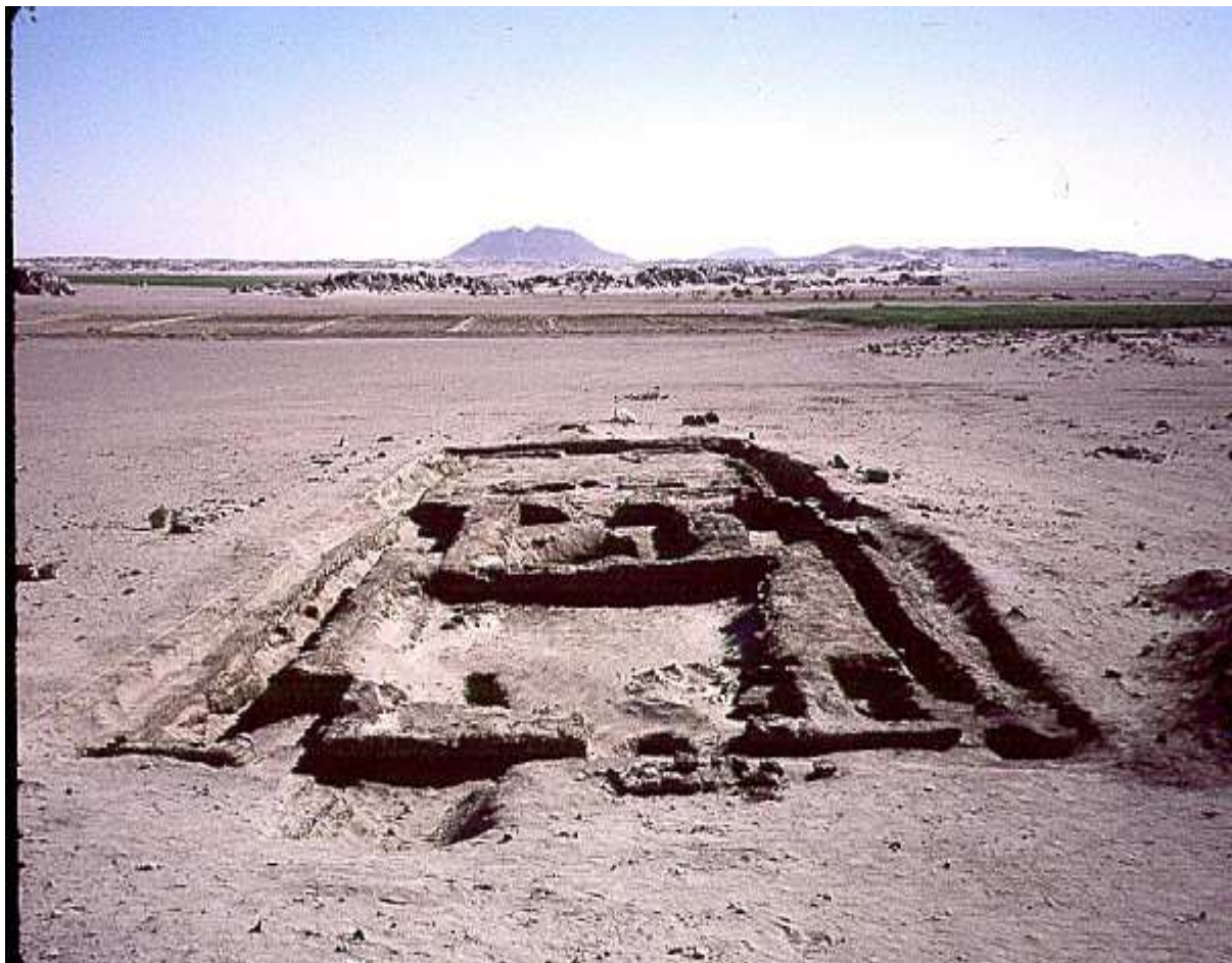
Pyramide de Tombos...