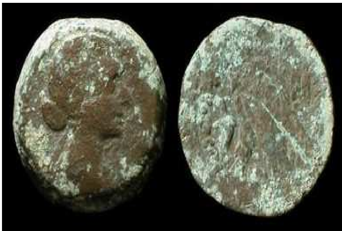
Cleopatra VII "Thea Neotera" ... 50 - 31 BC. Bronze 40-drachmae obol. Minted at Alexandria, Egypt.