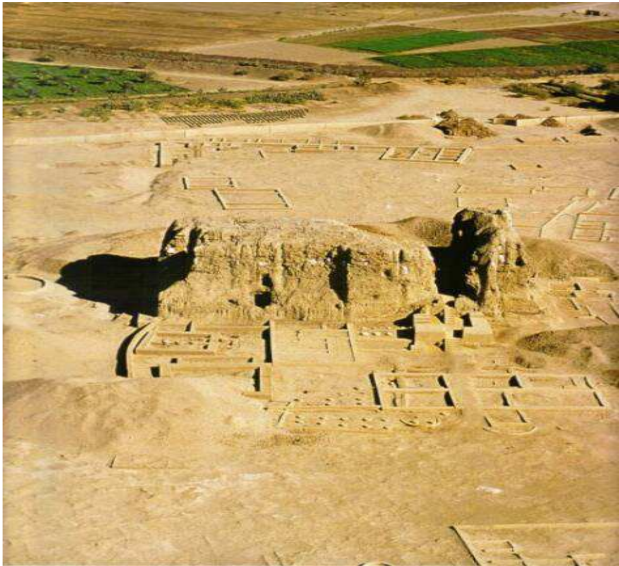
Ruines de la cité de Kerma...