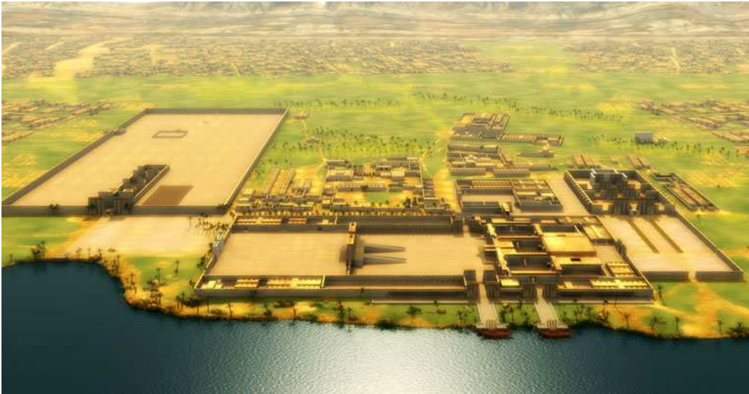
Reconstitution d'Akhet Aton...

L'Histoire est toujours en marche néanmoins !