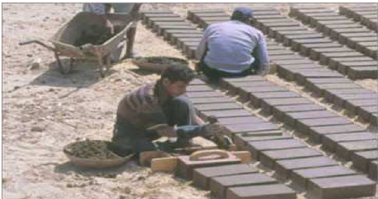
La fabrication de briques de terre nouvelles...