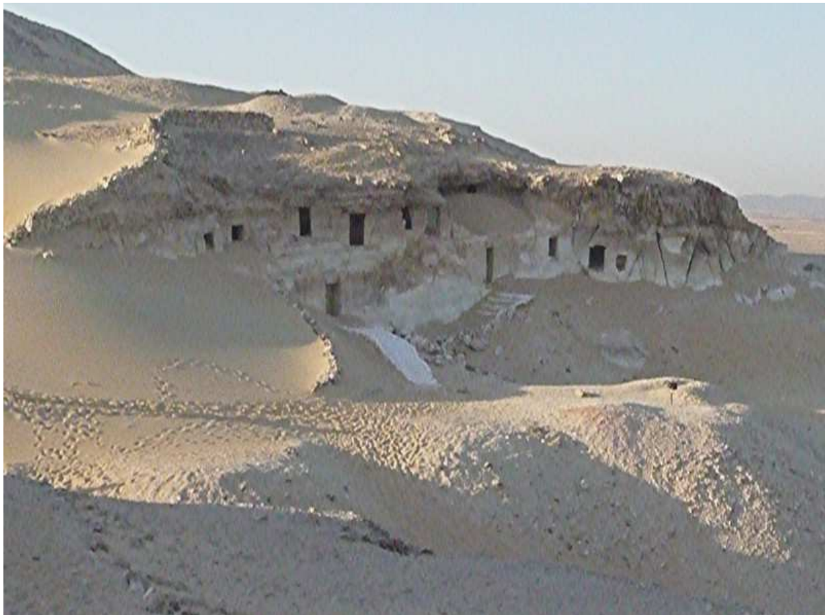
Tombe de Meir...