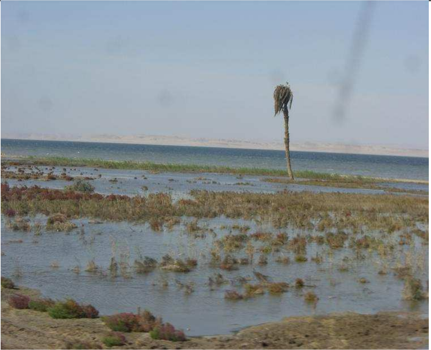
Le Fayoum entre la verdure et le sable...