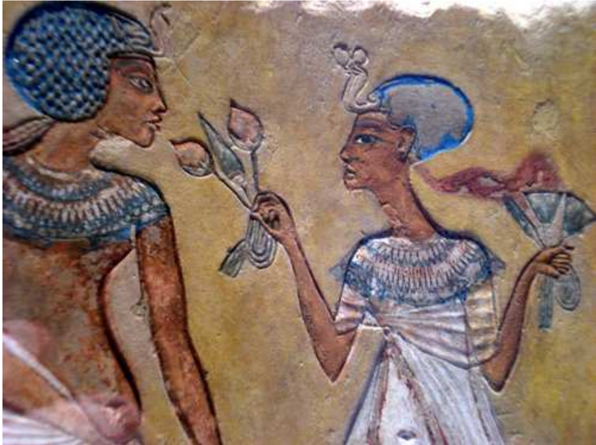
Akhetaton - Couple royal -

Peu importe les origines, un souverain épousant une reine devenait automatiquement pharaon !