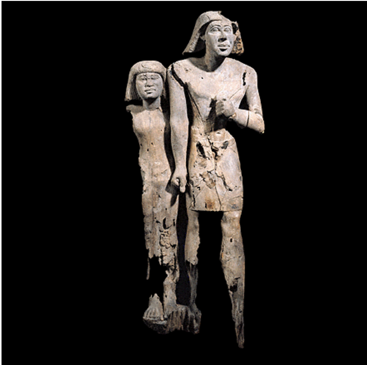
Couple d'époux. Ancien Empire, 6e dynastie, vers 2 350 - 2 200 av. J.-C. Bois d'acacia. H : 69 cm.