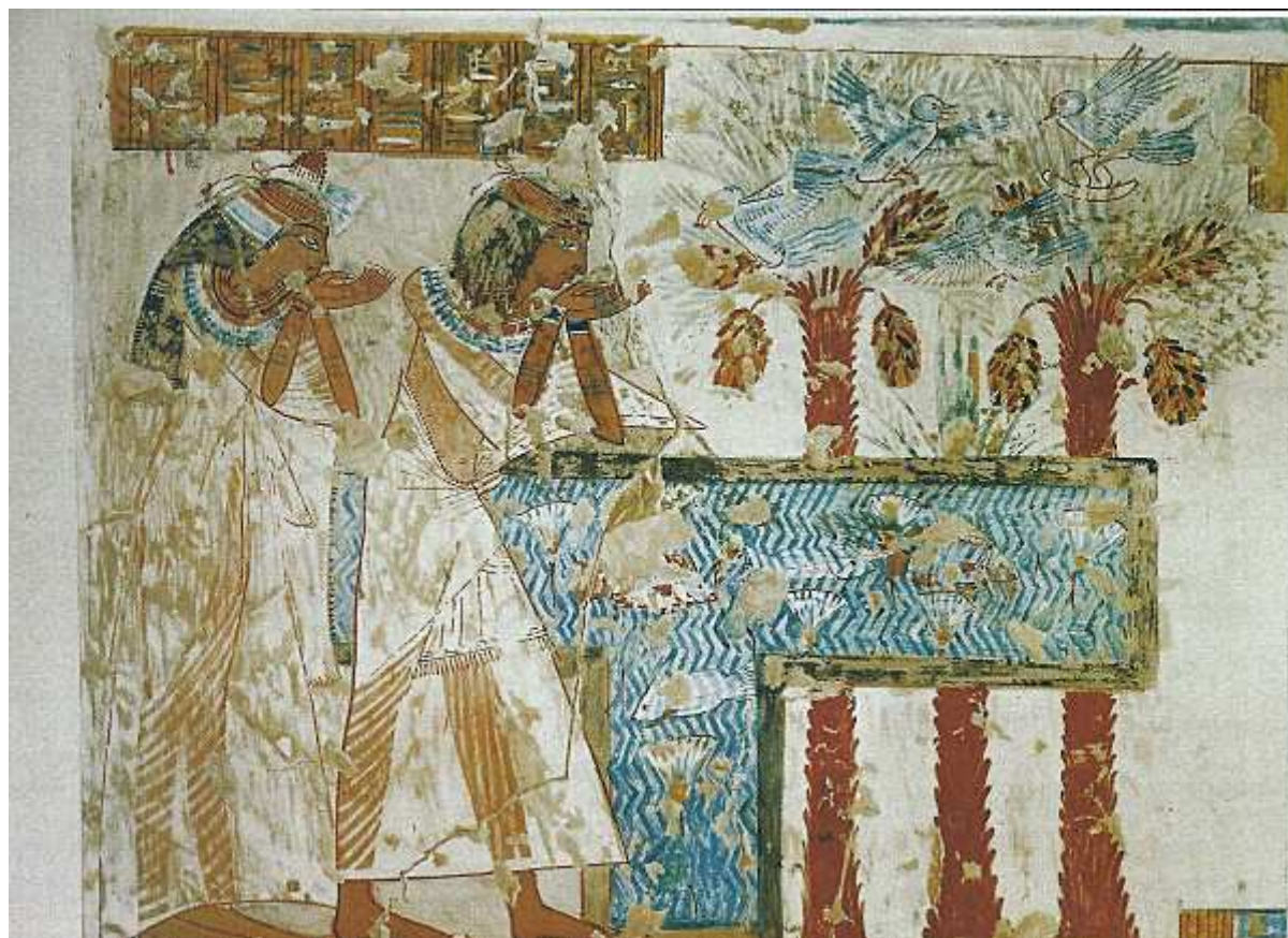
Le bonheur conjugal... Reproduction de Nina M. Davies. Paris... Bibliothèque du Louvre...