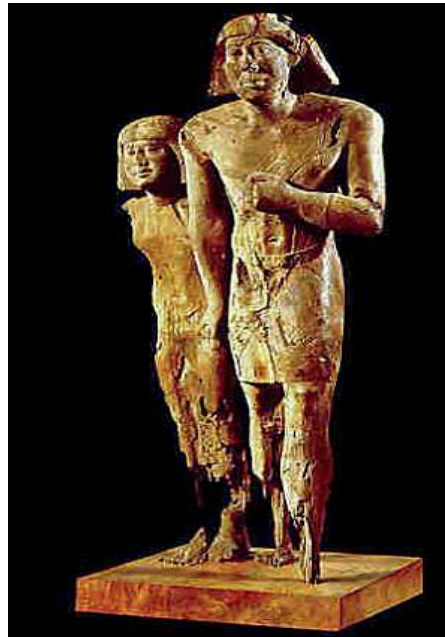
Rahotep et Nofret. Louvre.