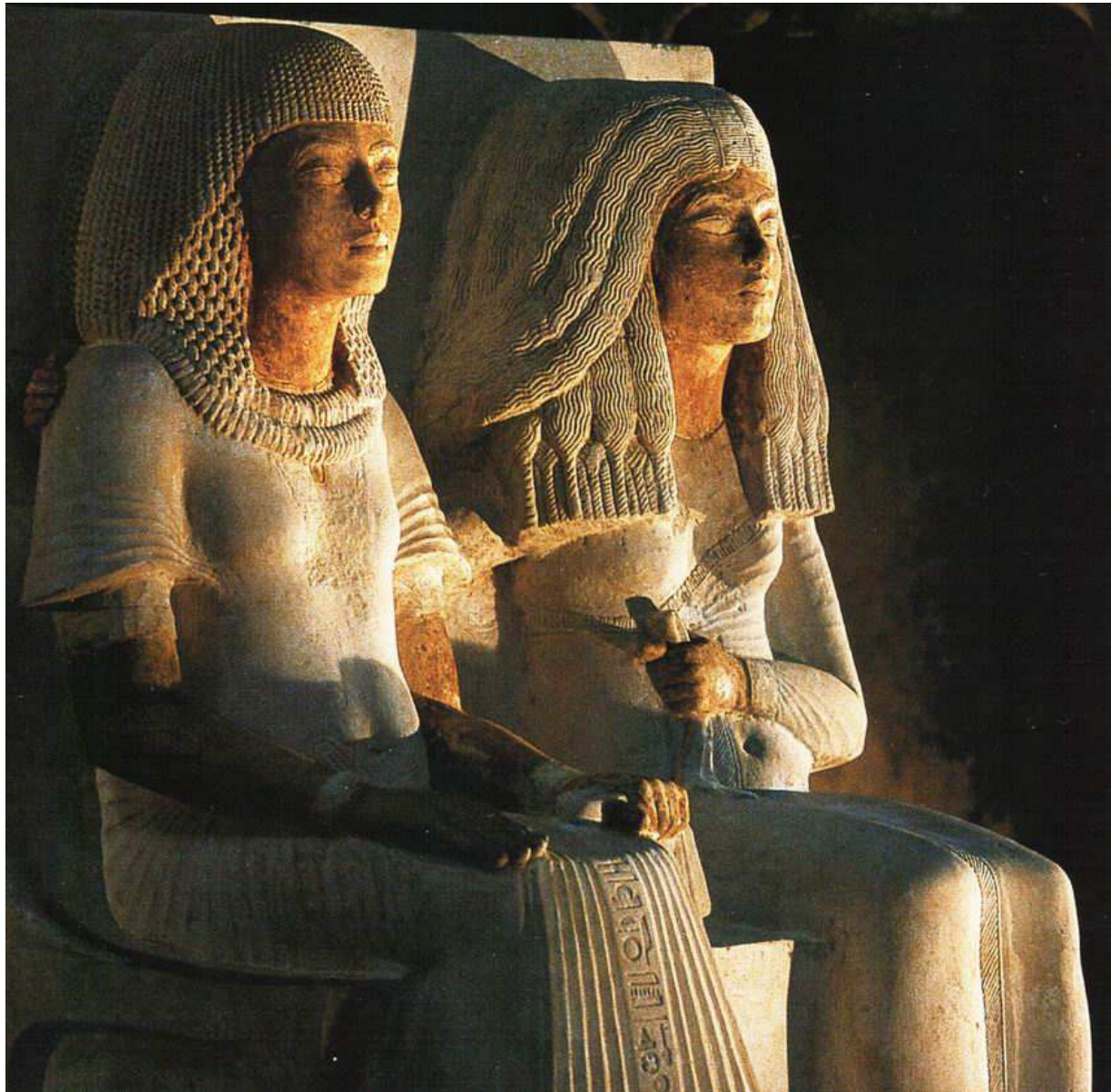
Couple de toute beauté ! Un vizir et son épouse !