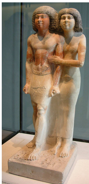
Voici un très beau couple... La tendresse semblait être un composant... Voici donc l'inspecteur des scribes Raherka et sa femme Mersêankh !