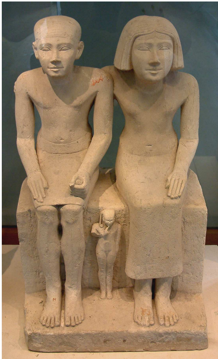
Deux époux et leur fils...