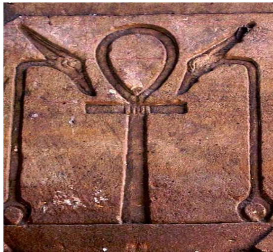
Croix de vie... Temple d'horus à Edfou...

Temps qui devait être considéré comme nécessaire afin de considérer que l'union puisse être solide !