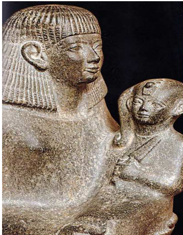
Sénènemout portant la princesse Néfèrourê...