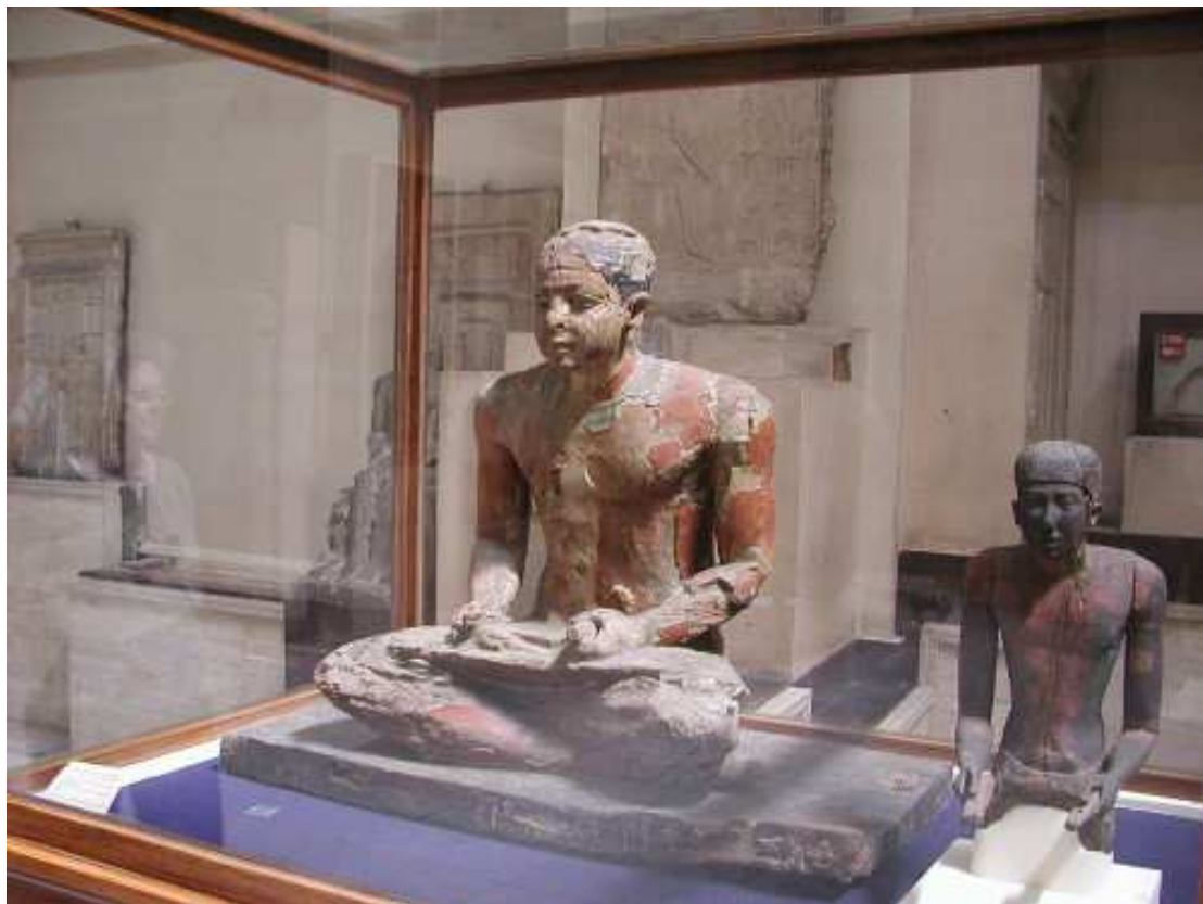
Scribe des Archives royales.

Participèrent-ils à la puissance de ce pouvoir central fort ?