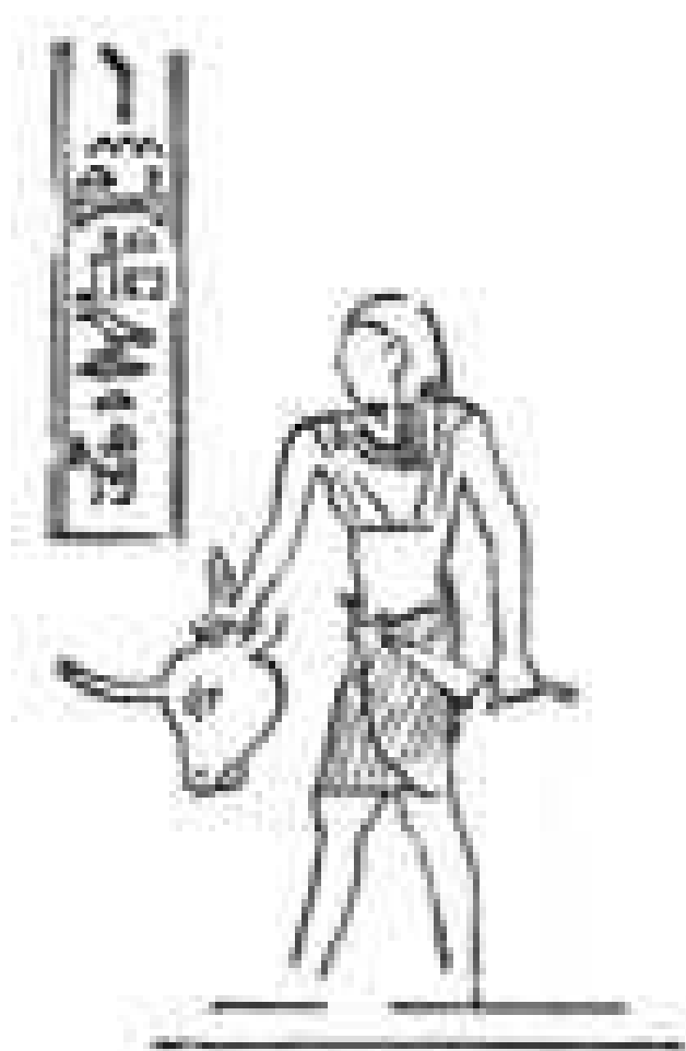
Le bas-relief du temple d'el-Khargeh. © Vandier Jacques, Le papyrus Jumilhac, CNRS, Paris, 1961.