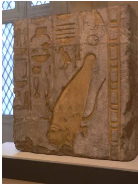
La netjeret Satet.

http://www.reshafim.org.il/ad/egypt/texts/nesuhor.htm