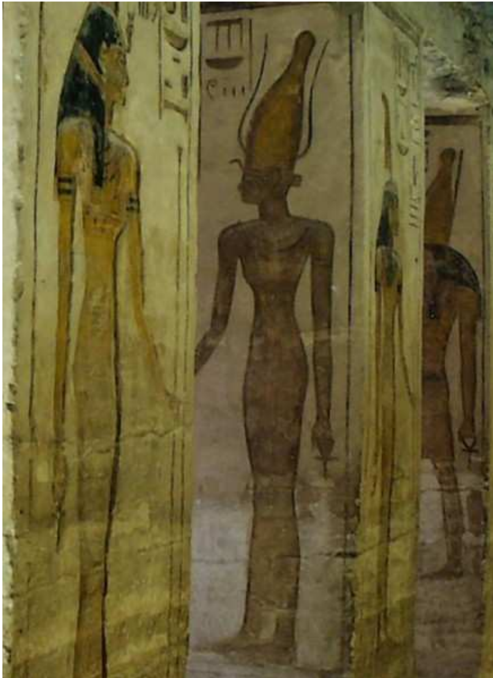
Voilà à nouveau notre belle Satet ! Provenant du temple d'Hathor de la reine Néfertari... Abou Simbel... Source / Lien