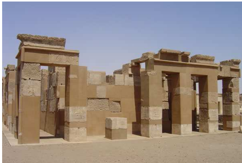
Temple de Satis, épouse de Khnoum...

Construit sous le règne d 'Hatchepsout !