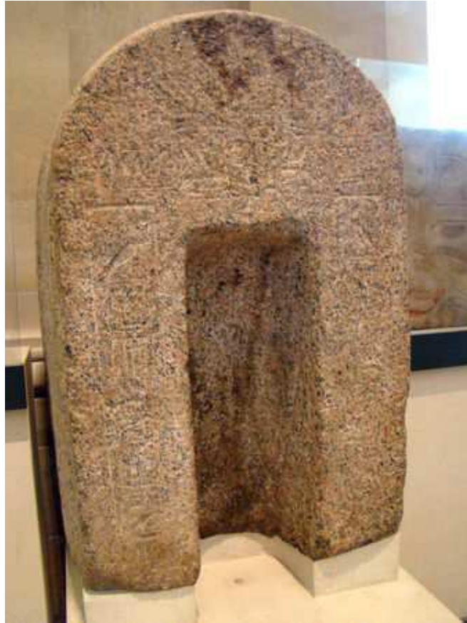
Ce naos abritait la statue de la netjeret Satet.