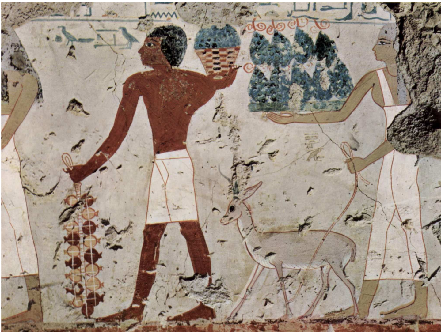
Chambre funéraire d'Amenemhat... Officier de haut rang dans le règne de Thoutmosis III.

Tout aussi paradoxale certainement fut bien sa capacité inhérente quant à la maîtrise des animaux sauvages ! D'autant plus qu'il semblerait bien qu'il eu une unique vocation, celle de les dompter !