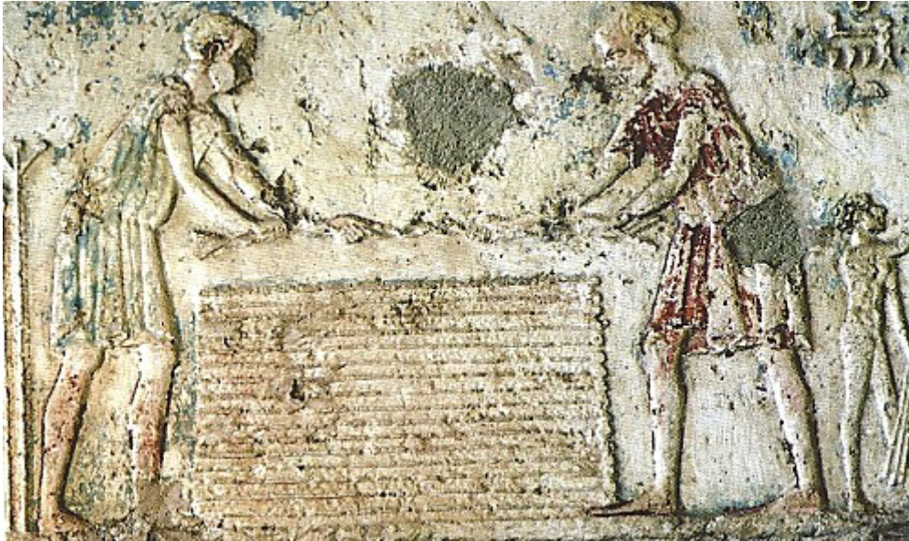
Enfants à droite... Bas relief à Hermopolis. Époque Ptolémaïque.