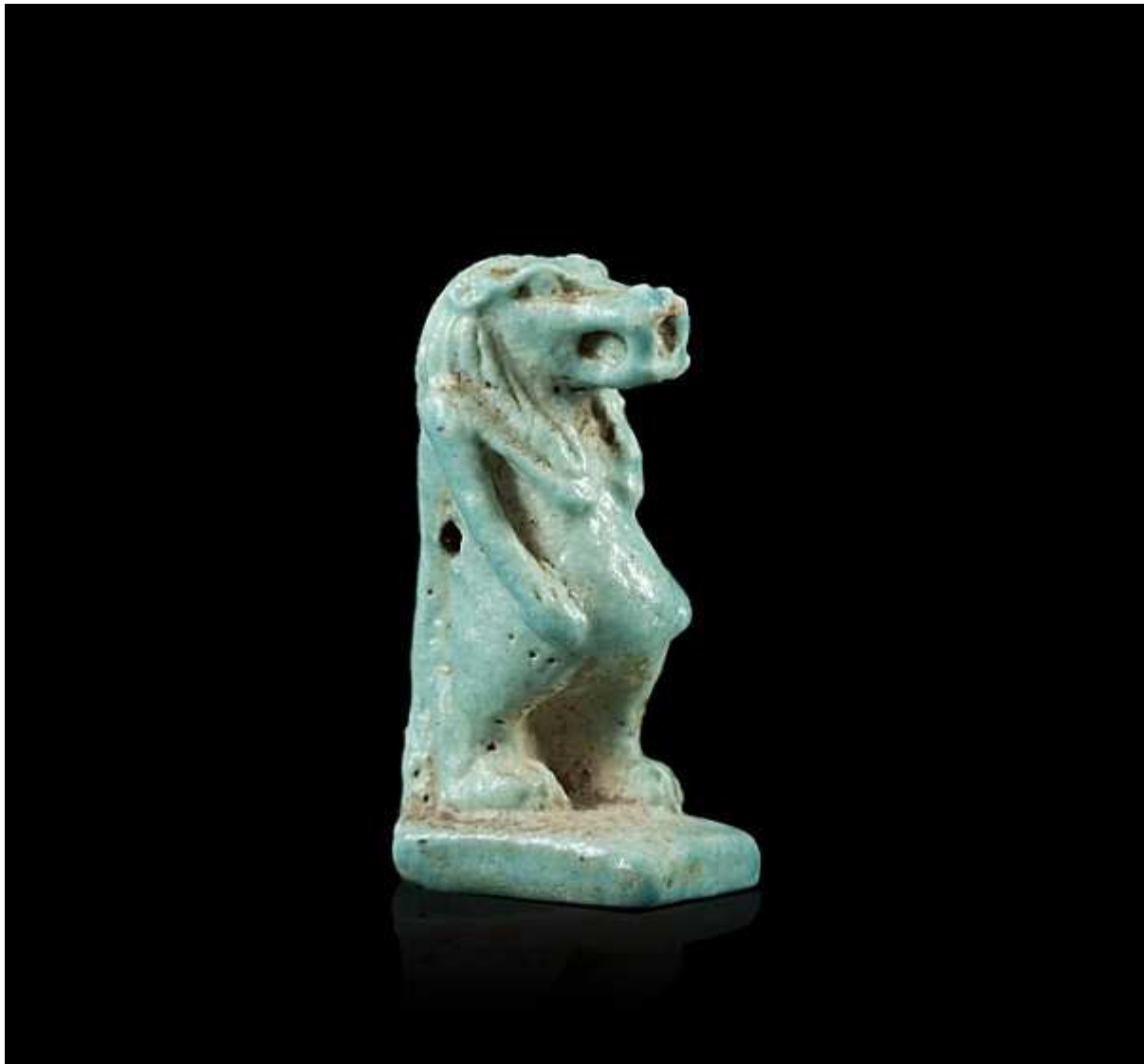
Amulette en forme de Thoueris...