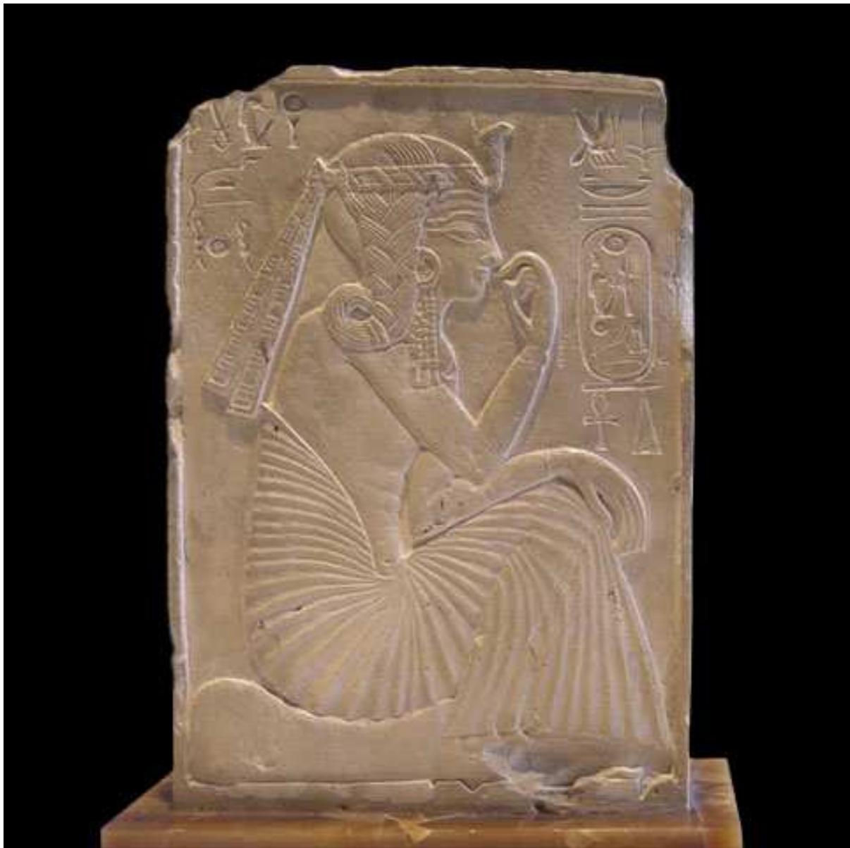
Ramsès II. Représenté comme un enfant !

→ La marque de l'enfance, la tresse sur le côté !