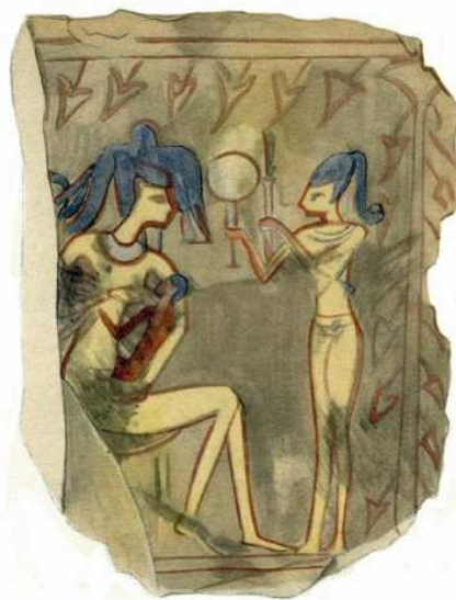
Aquarelle de J. Vandier d'Abbadie (ostracon Deir el-Médîna)

"La mère, l'enfant et le lait en Egypte ancienne : traditions médico-religieuses : une étude de sénologie égyptienne" (textes médicaux des Papyrus Ramesseum nos III et IV), Jean, Richard-Alain; Loyrette, Anne-Marie. 516 pages, ISBN 9782296130968, collection KUBABA.