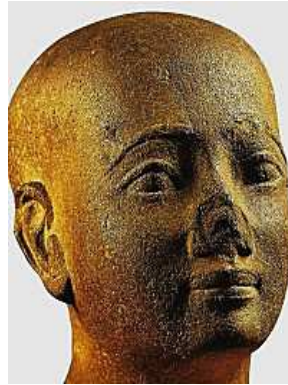
Turin, Museo Egizio.