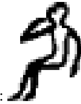
Enfant A17 :