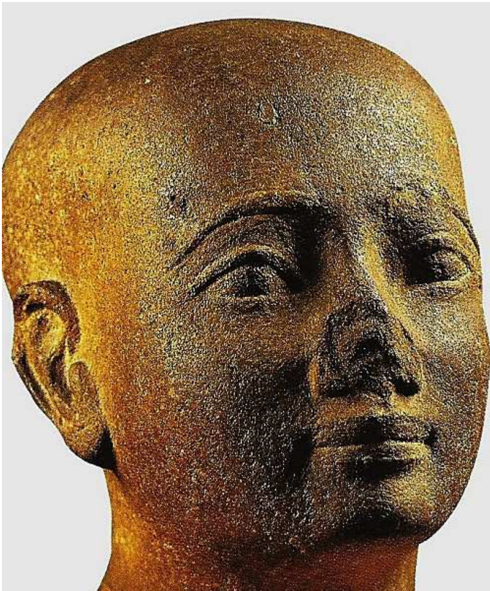
Turin. Museo Egizio.