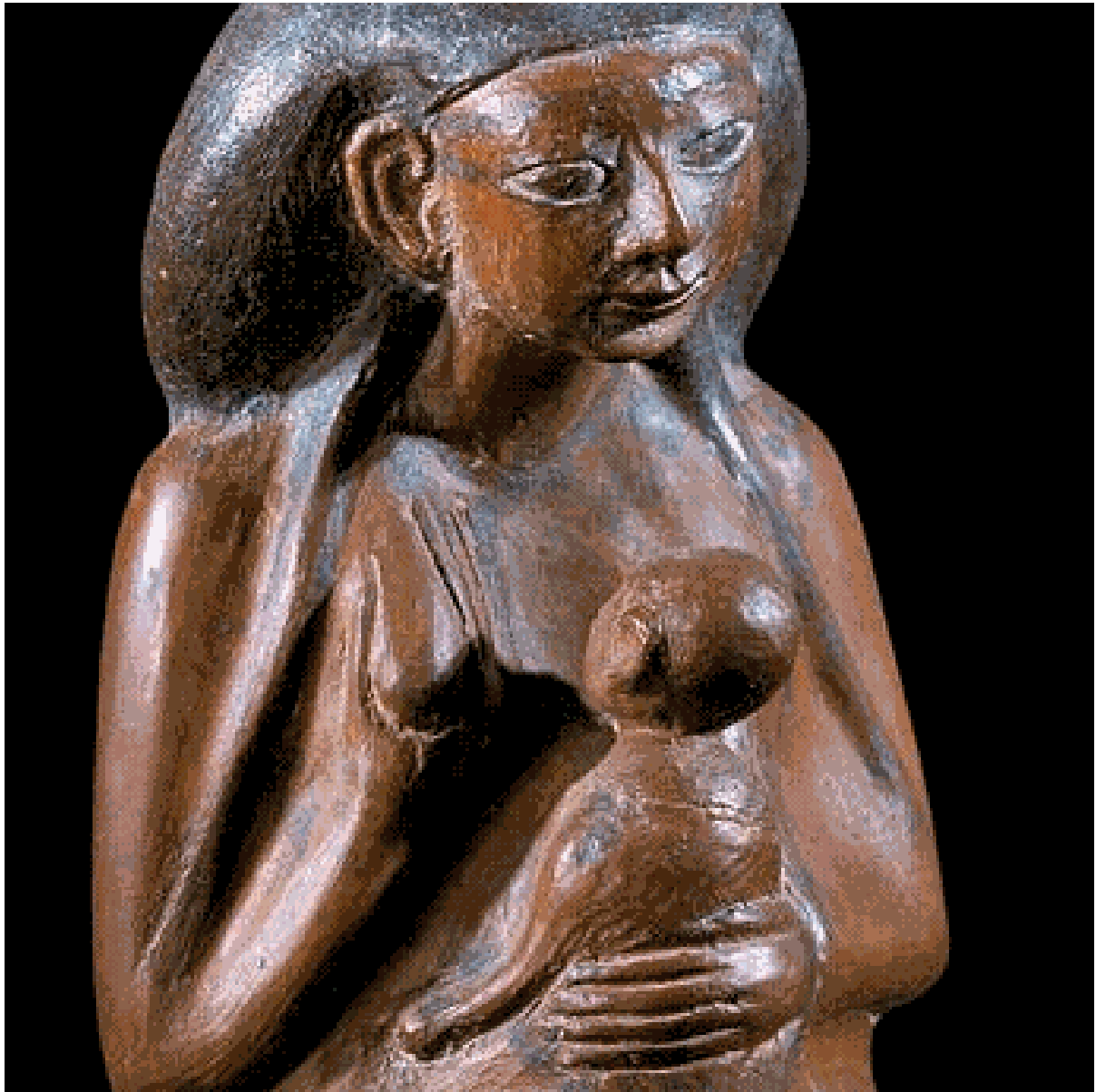
Vase en forme de femme agenouillée avec un enfant Nouvel Empire, 18 e dynastie, vers 1550 à 1295 av. J.-C. Terre cuite rouge et noire.

Et voici le genre de vase dont j'aurais souhaité posséder ! Qu'en penser-vous ?