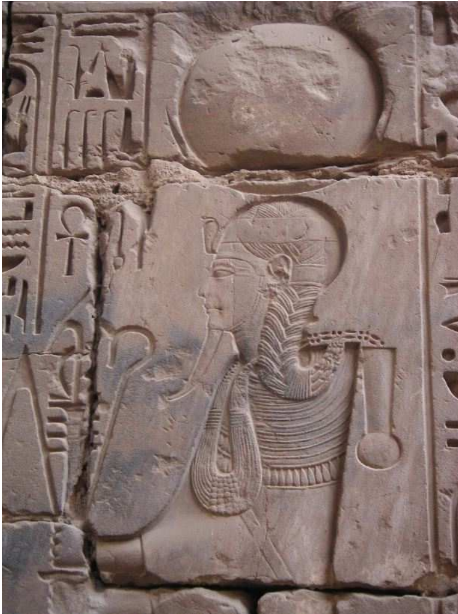
Relief représentant le dieu Khonsou. Coiffé du disque lunaire sur un croissant de lune... Temple de Khonsou à Karnak. 20e dynastie.