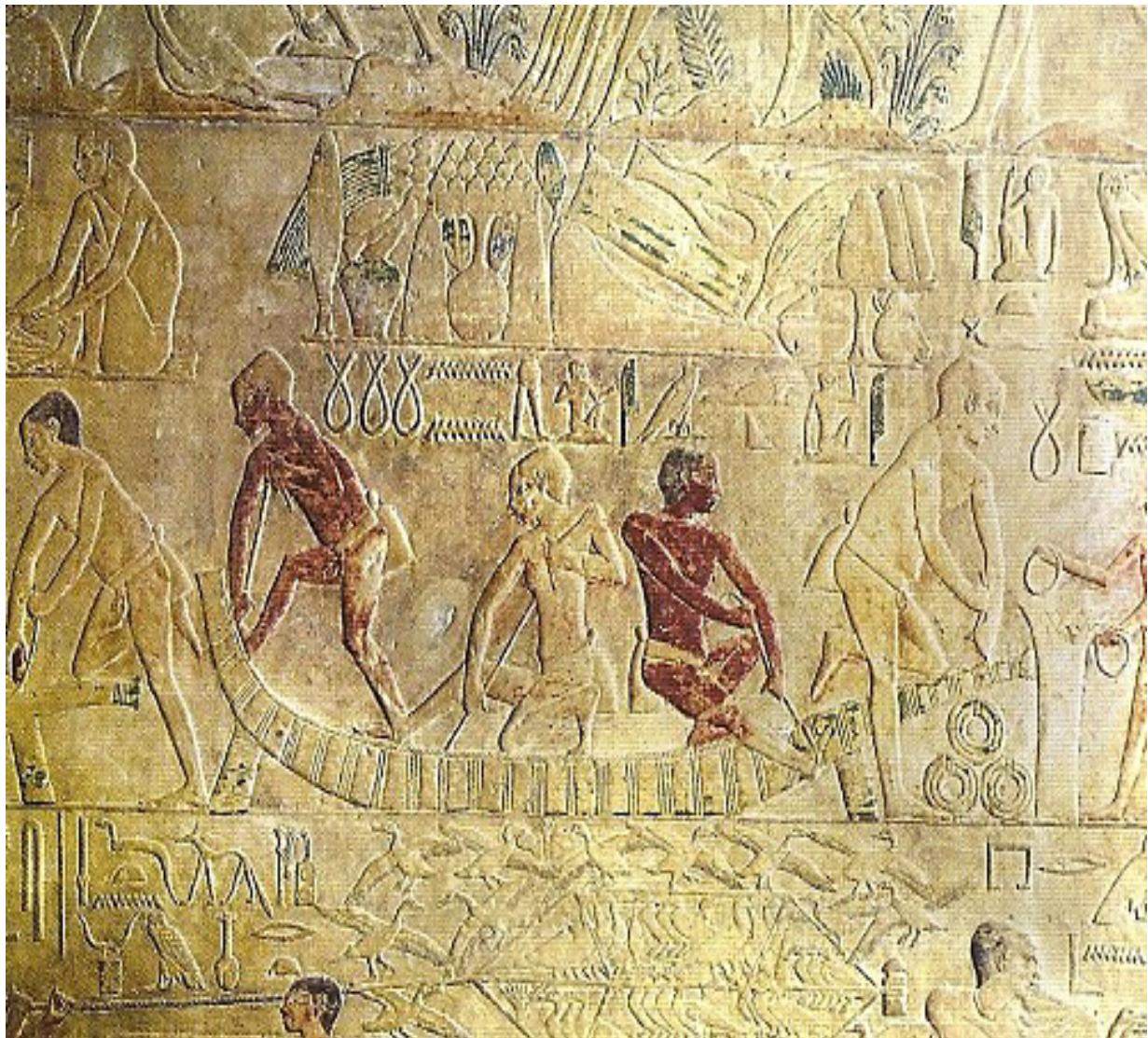
Bas-relief dans un hypogée de la 5e dynastie à Saqqarah.

Voyez à droite, un enfant aide à la fabrication d'une barque en papyrus :