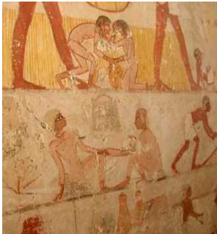
L'hypogée de Menna.