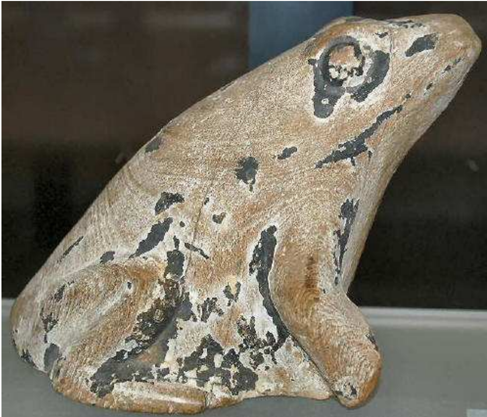
Grenouille en bois. Musée du Louvre.

Ainsi, la grenouille fut l'incarnation de la netjeret Heqet !