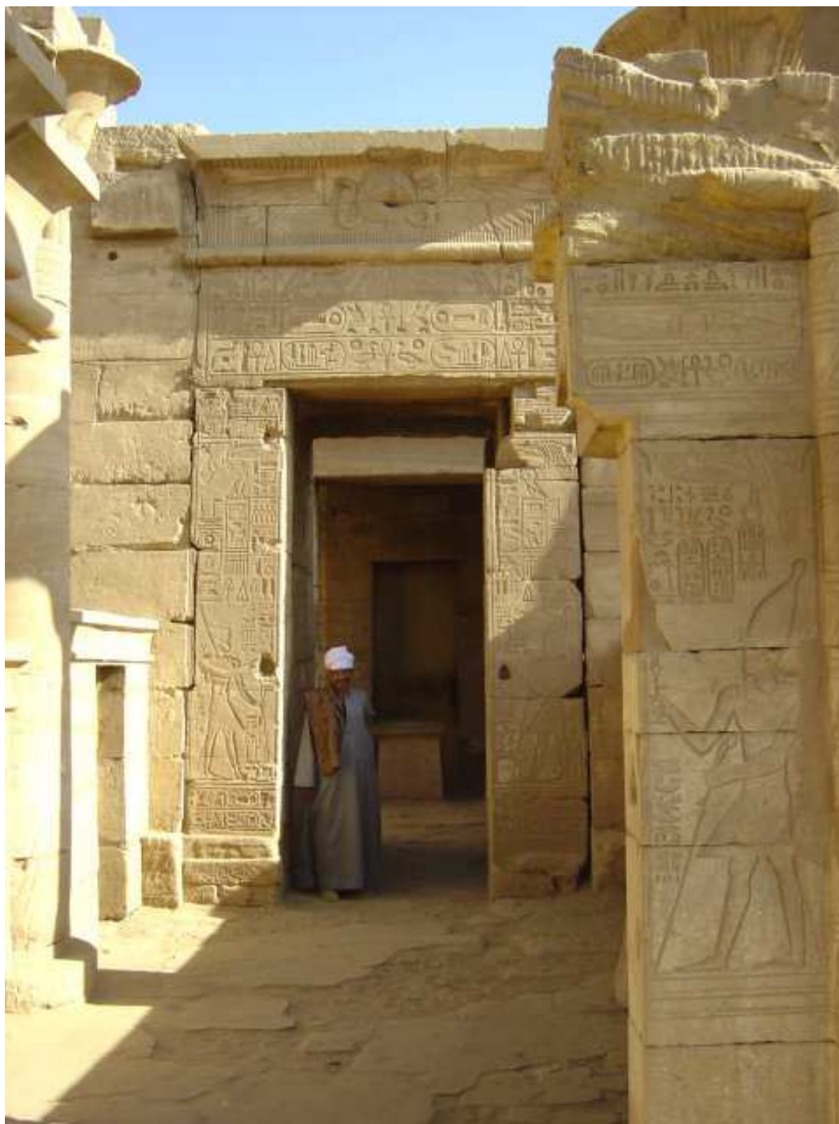
Temple de Ptah Karnak