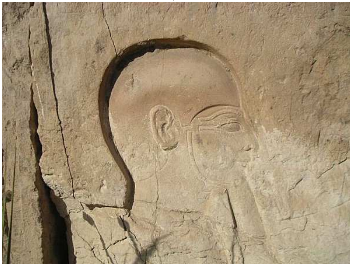
Le visage du dieu Ptah - Relief du temple d'Hathor à Memphis - XIXe dynastie égyptienne