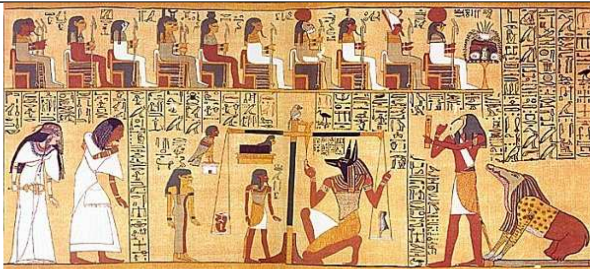
Planche III du papyrus d'Ani. "Livre pour sortir au jour" d'Ani, 1 275 avant JC.