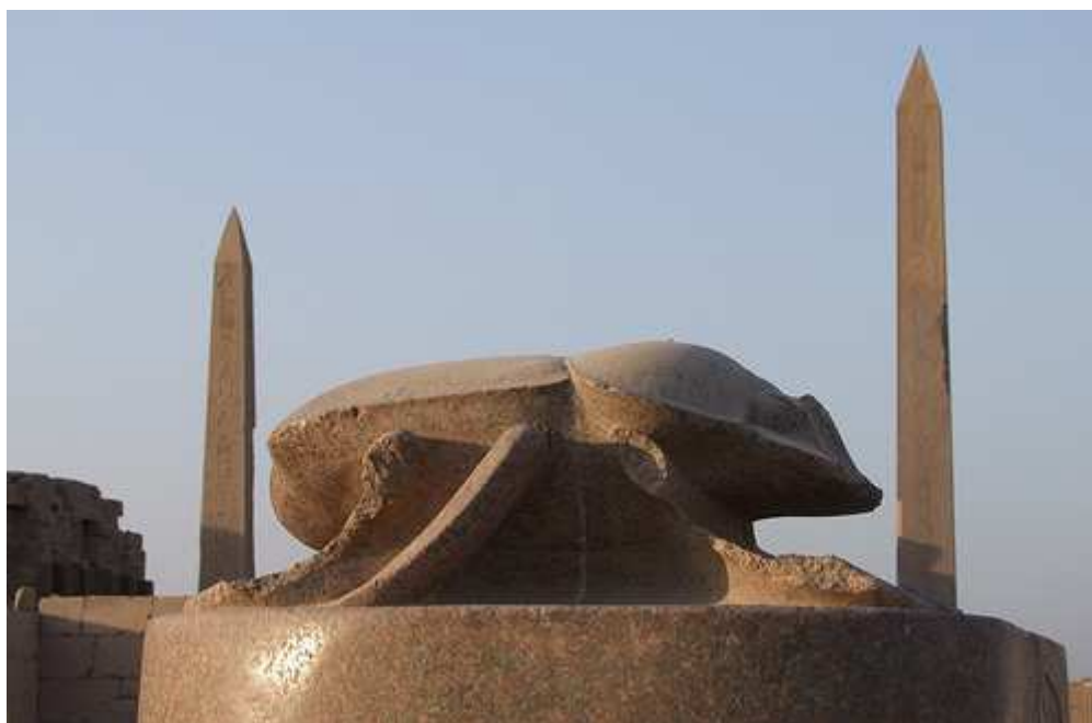
Un scarabée géant sculpté en granit. Provenant du temple funéraire d'Aménophis III.