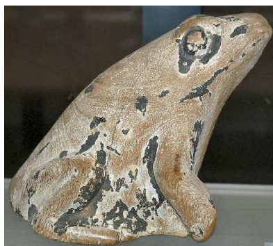
Grenouille en bois. Musée du Louvre.