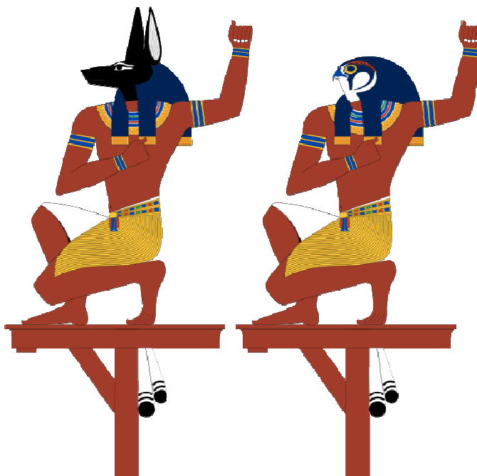
Les âmes de Pé (Faucon)