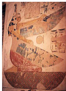
Hypogée de Siptah...

Ce qui devrait signifier porteuse d'ailes !