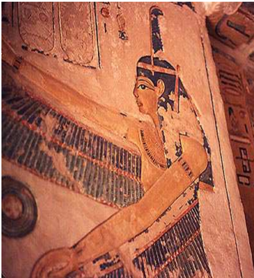
Dans un corridor de l'hypogée de Siptah. Pharaon de la 19e dynastie.

Maât est présente dans le cartouche de plusieurs pharaons !