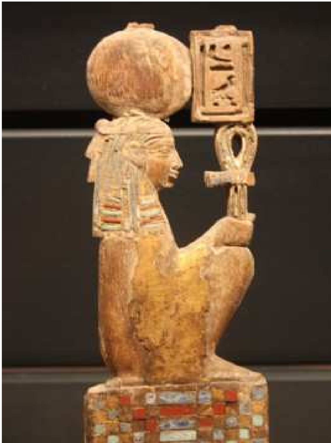
La déesse Maât portant la croix ansée ! Louvre, E 185, Salle 7 vitrine 9. Décor de mobilier ajouré IV e siècle avant J.-C. Enduit, peint, doré et incrusté de verre.