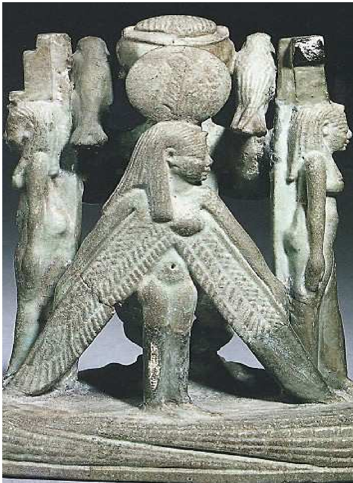
Figurine magique montrant Ptah entouré d' Isis et de Nephthys .

Au premier plan le nètèr Maât ptérophore .