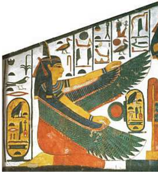
Maat with Nefertari Cartouche.

Davantage qu'une qualité... Davantage qu'un nètèr... Ce fut bien un principe !