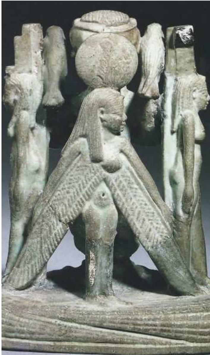
Figurine magique montrant Ptah entouré d' Isis et de Nephthys . Au premier plan, la netjeret Maât ptérophore ! Faïence de la basse Époque. Louvre.