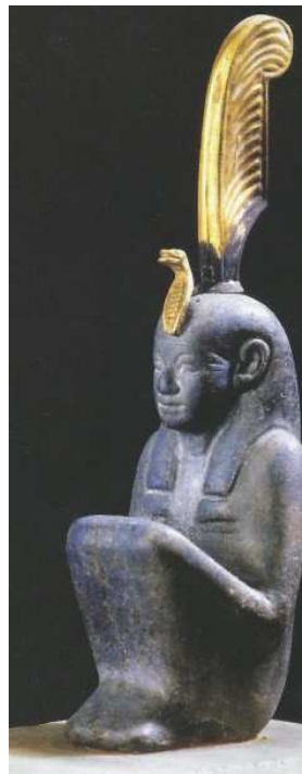
Statuette de la nejeret Maât.

Davantage qu'une qualité... Davantage qu'un netjer... Ce fut bien un principe !