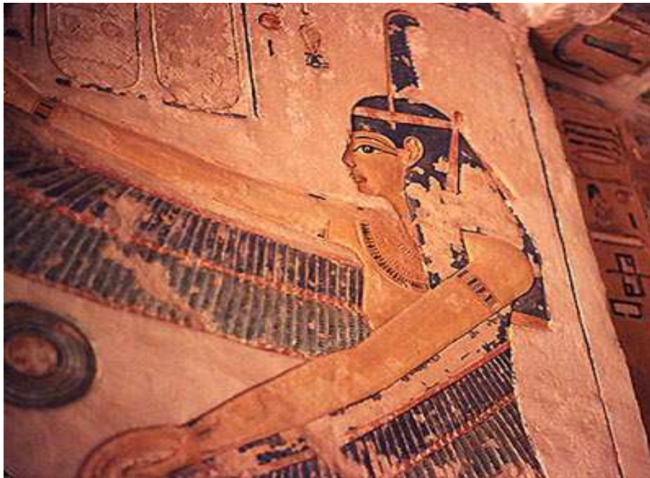
La nejeret Maât ptérophore, dans un corridor de l'hypogée de Siptah. Pharaon de la 19e dynastie.