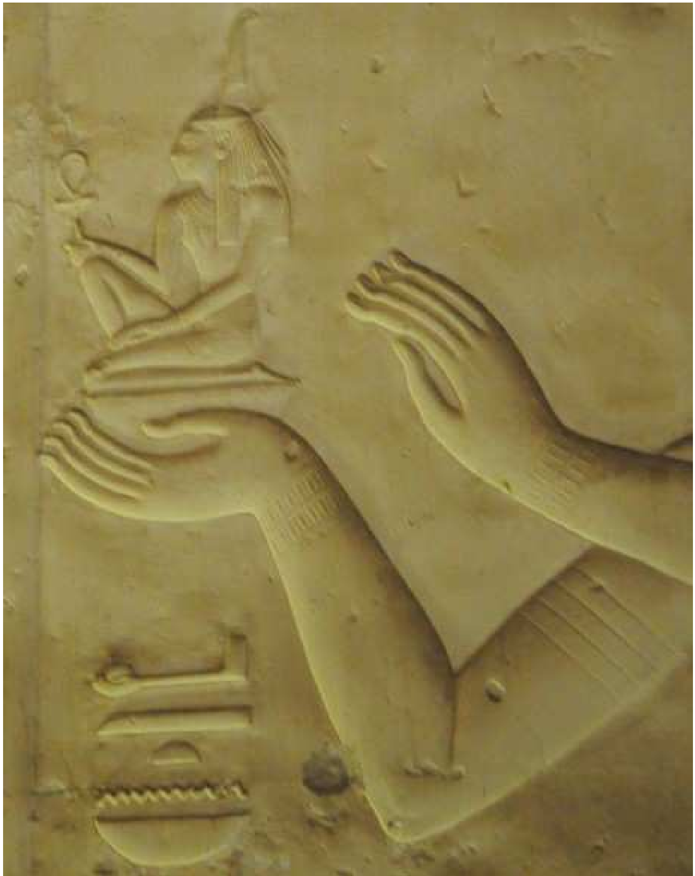
Haut-relief représentant l'offrande de Maât par le pharaon Sethi I...