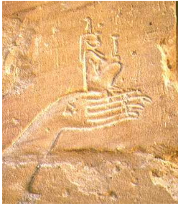
Temple de Dakka.