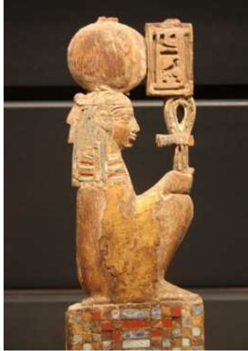
La netjeret Maât portant la croix ansée ! Louvre, E 185, Salle 7 vitrine 9. Décor de mobilier ajouré IV e siècle avant J.-C. Enduit, peint, doré et incrusté de verre.