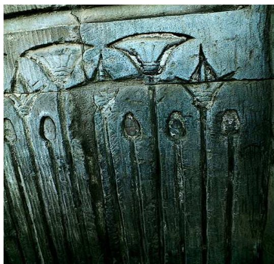
Les fleurs du Nil... Représentation du Lotus !