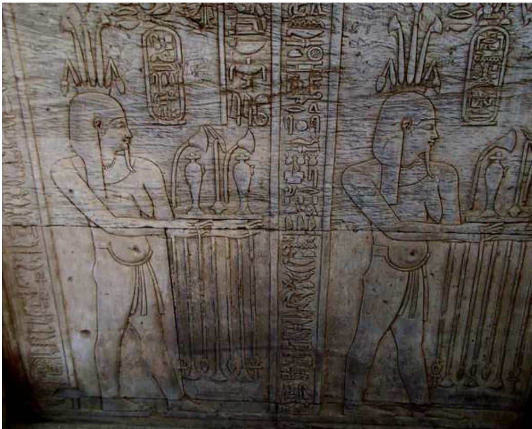
Représentation du netjer du Nil, Hâpy ! Kom Ombo.