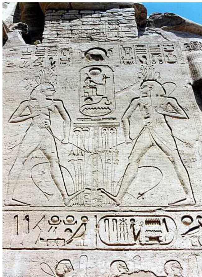
Abou Simbel. Le temple de Ramses II.