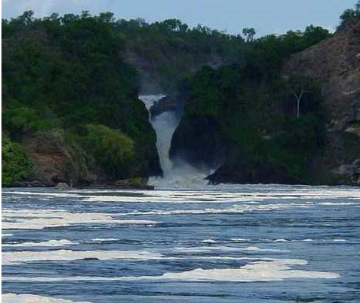
Le Nil en Ouganda. Photo du Nil ou Hâpy régnait en maître !