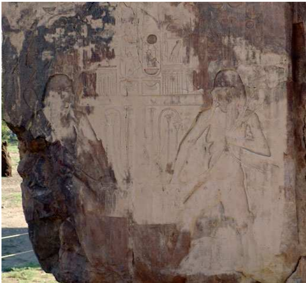
Les netjerou du Nil nouaient le nœud sematawi... Symbole d'unification de la Haute et de la Basse-Égypte !