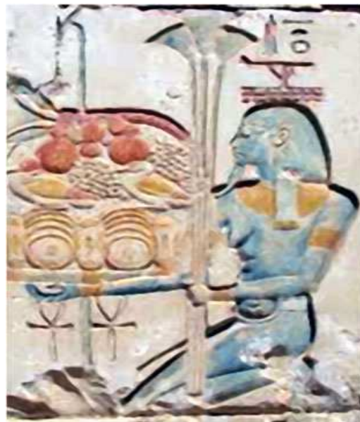
Temple de Philae...