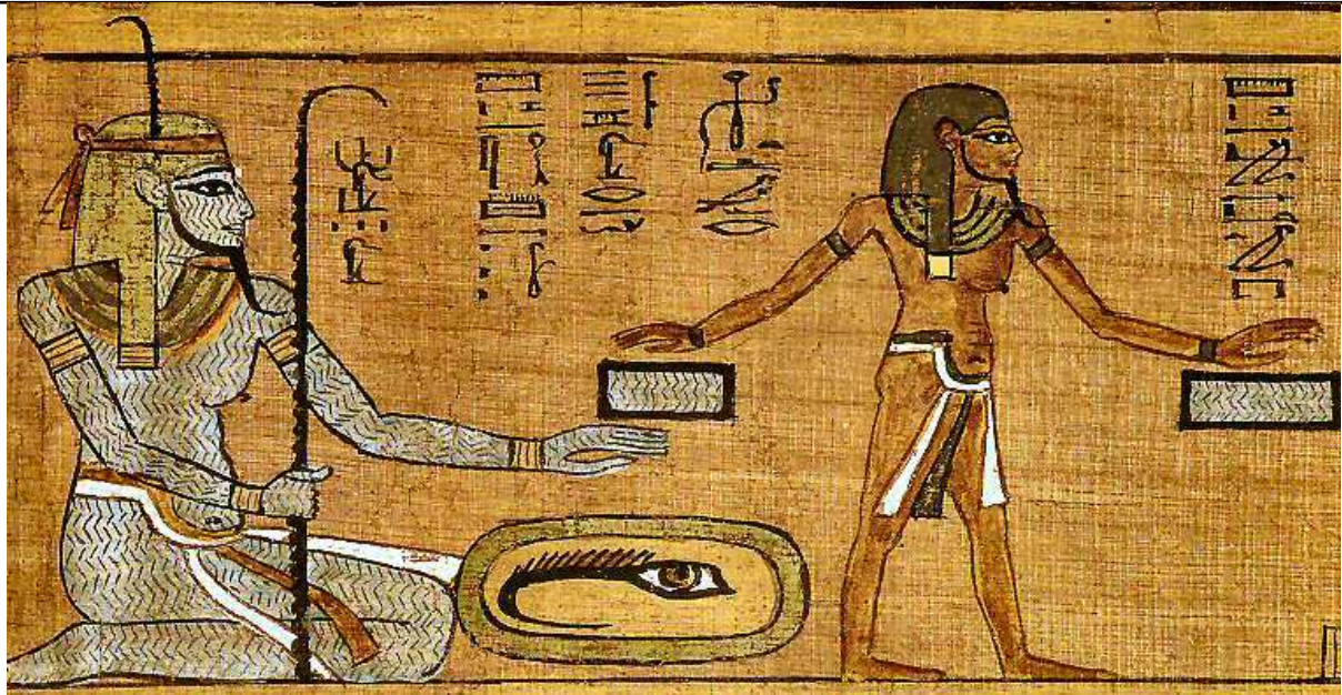
Extrait du "Livre pour sortir au jour" d'Ani...