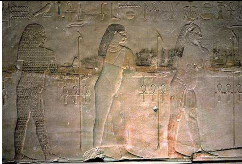
Temple de Sahourê. Netjer de la fécondité...