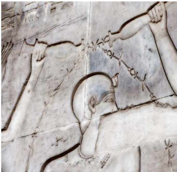
Un merveilleux cadeau ! La vie qui s'écoule autour du pharaon...

Mais également les prêtres... Tous transportaient la statue du culte sur la terrasse du temple afin de célébrer le renouveau du cycle annuel !