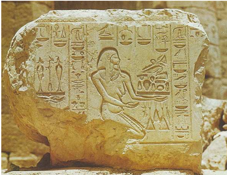
Le netjer Hapy portant une coupe de fruits. Fragment d'un relief de Médinet-Habou. 20e dynastie.