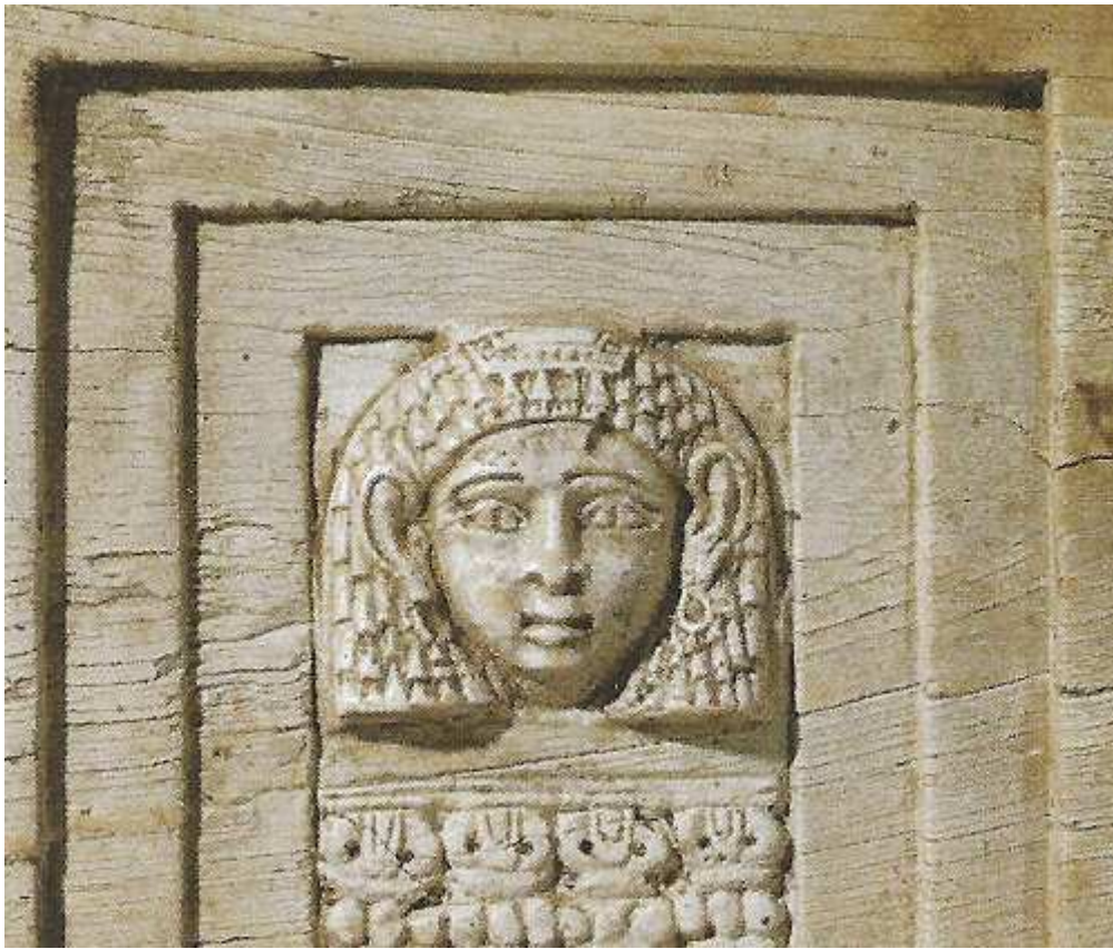
Relief en ivoire provenant du nord de la Syrie. On y voit le nétèr Astarté dans l'ouverture d'une fenêtre. Elle fut la sœur d'Anat. Louvre

Une preuve, s'il en est, que Kemet, à un moment donné de son histoire en tous cas, fut ouverte vers l'extérieure et ceci on le voit bien en l'entité du nétèr Anat !