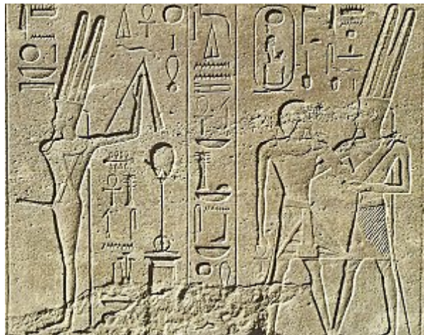
Bas-relief de la Chapelle rouge de Karnak.

De gauche à droite : Min , le pharaon Hatshepsout vêtue en homme et Amon. (18 e dynastie).