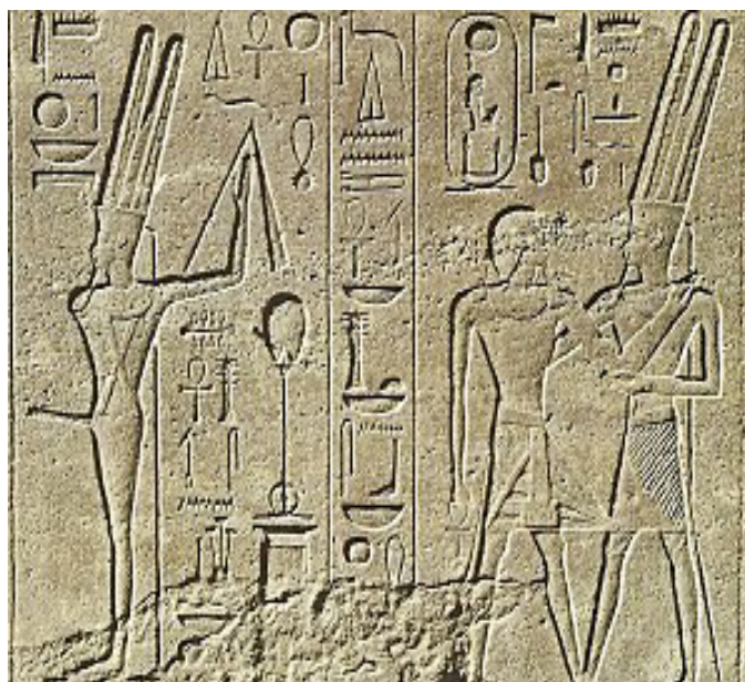
Bas-relief de la Chapelle rouge de Karnak.

De gauche à droite : Min , le pharaon Hatshepsout vêtue en homme et Amon. (18e dynastie).