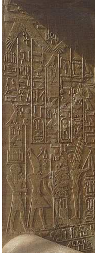
Ka guidant Sésostri I vers le nètèr Amon-Min. Bas relief de la Chapelle Blanche de karnak .

C'était par leur Ka que les hommes avaient la possibilité de communiquer avec les nètèrou !