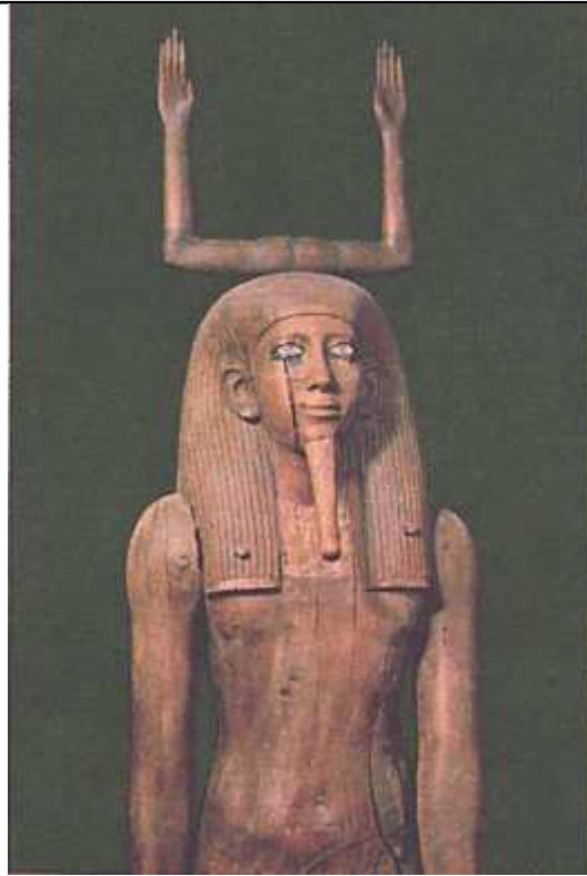
Statue en bois Représentation du ka du roi Hor Aoutibré (XIIIe dynastie)