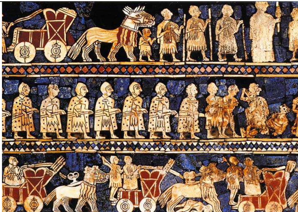
La "face de la Guerre"

"Étendard Our" (vers 2600 avant notre ère. British Museum).