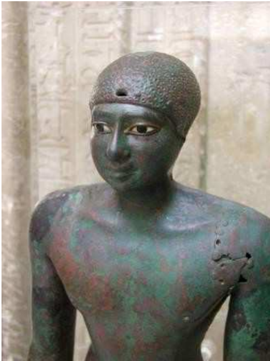
Le pharaon noir Pépi I... 6e dynastie 2 350 - 2180.