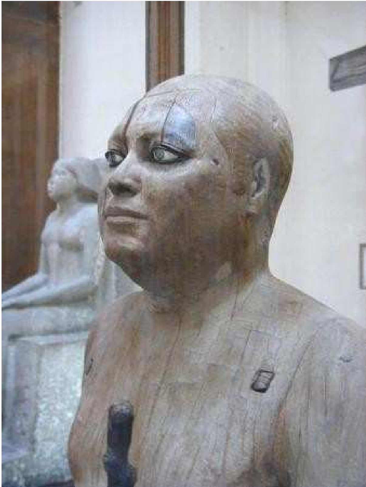
"The famous wooden statue called the Shekh el-Beled in the Museum, Cairo, Égypt "