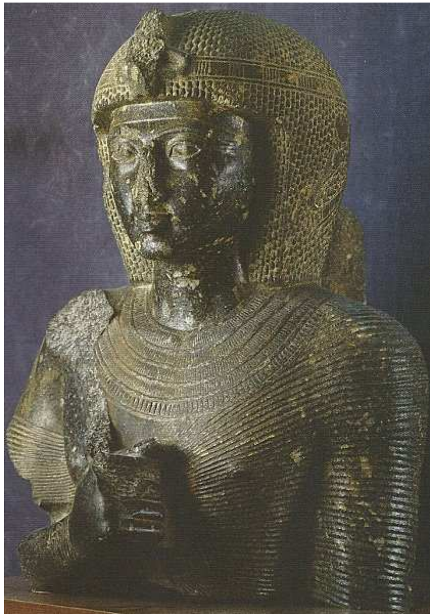
Buste du pharaon Ramses II, retrouvé à Tanis dans le delta du Nil - Le Caire -

Tel est le nom véritable, de cette grande capitale antique, que nous recherchons actuellement !