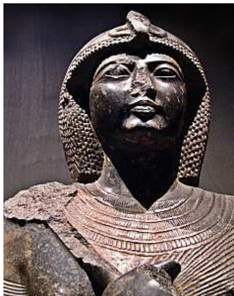
Statue de Ramsès II provenant de Tanis - Musée égyptien du Caire -

- Pour la majorité des chercheurs, Tanis, Avaris et notre fameuse capitale tant recherchée ne formaient qu'une seule et même ville !