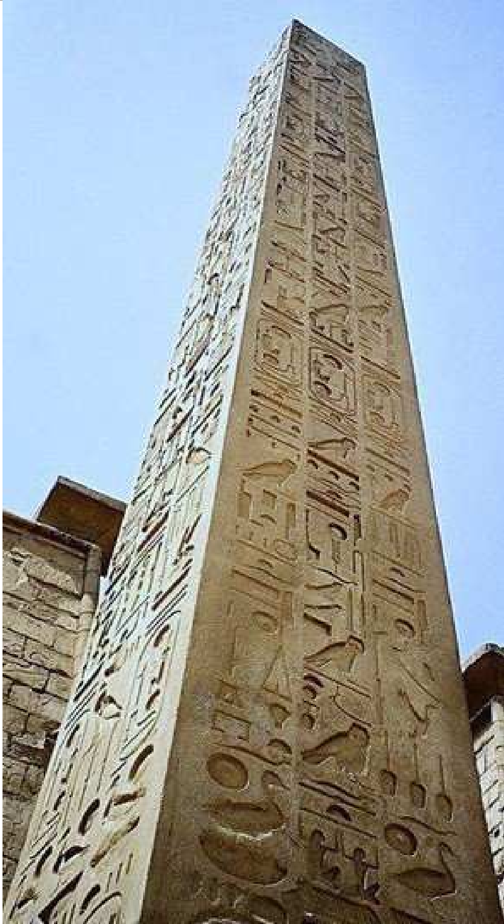
Cet obélisque est le jumeau de celui de la place de la Concorde...