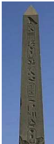
Sésotris I à Héliopolis !

Malgré tout, avec un certain regret, je puis vous informer qu'il représente pratiquement le seul vestige de cette antique cité.