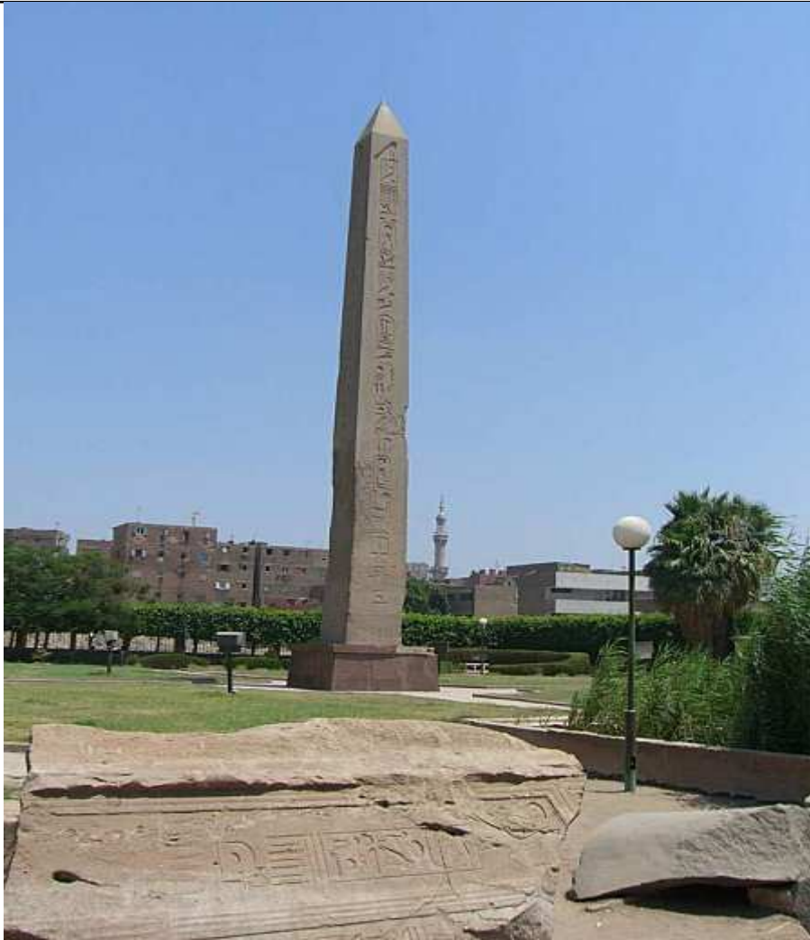
Obélisque de Sésotris I à Héliopolis. (XIIe dynastie)

Dans un parc payant, mais néanmoins bien public à Héliopolis, vous aurez l'occasion de faire cette grandiose rencontre avec l'obélisque de Sésotris I.