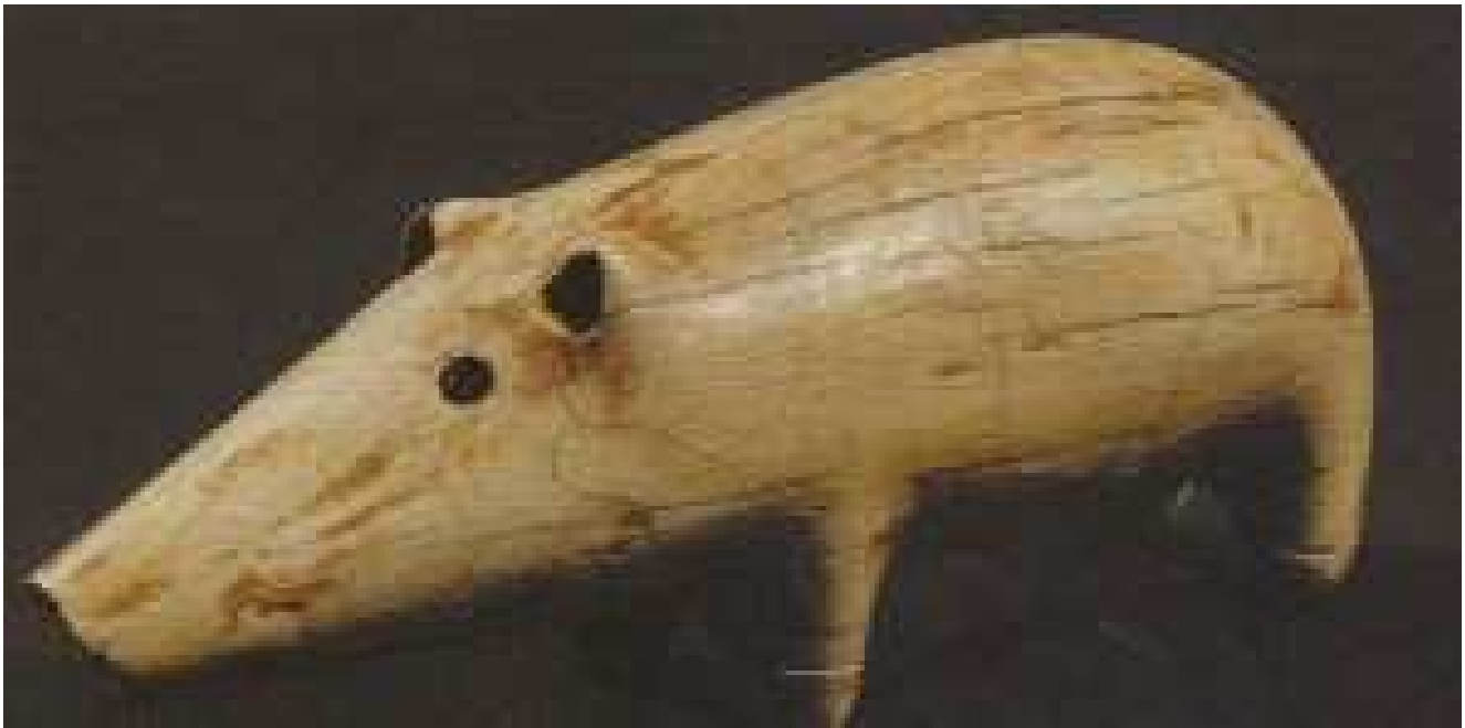
Petit sanglier en ivoire d'époque prédynastique...

Au sein même probablement du nid familial... ! (?)