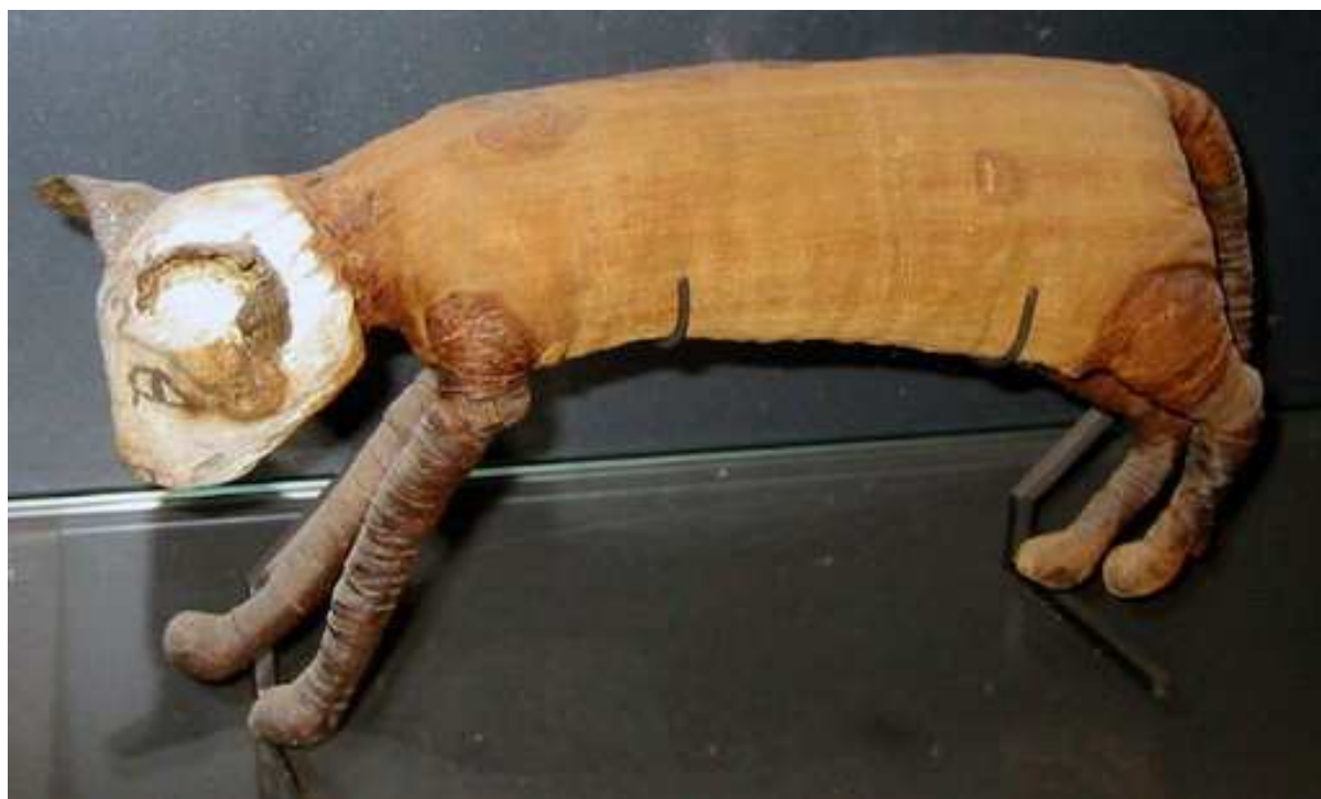
Antiquité égyptienne, Musée du Louvre. Pavillon sully.