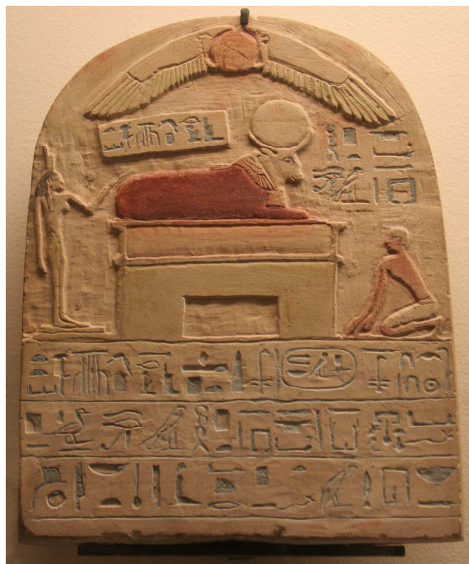
Stèle dédiée au taureau Api par le portier du temple Horoudja... Calcaire peint...