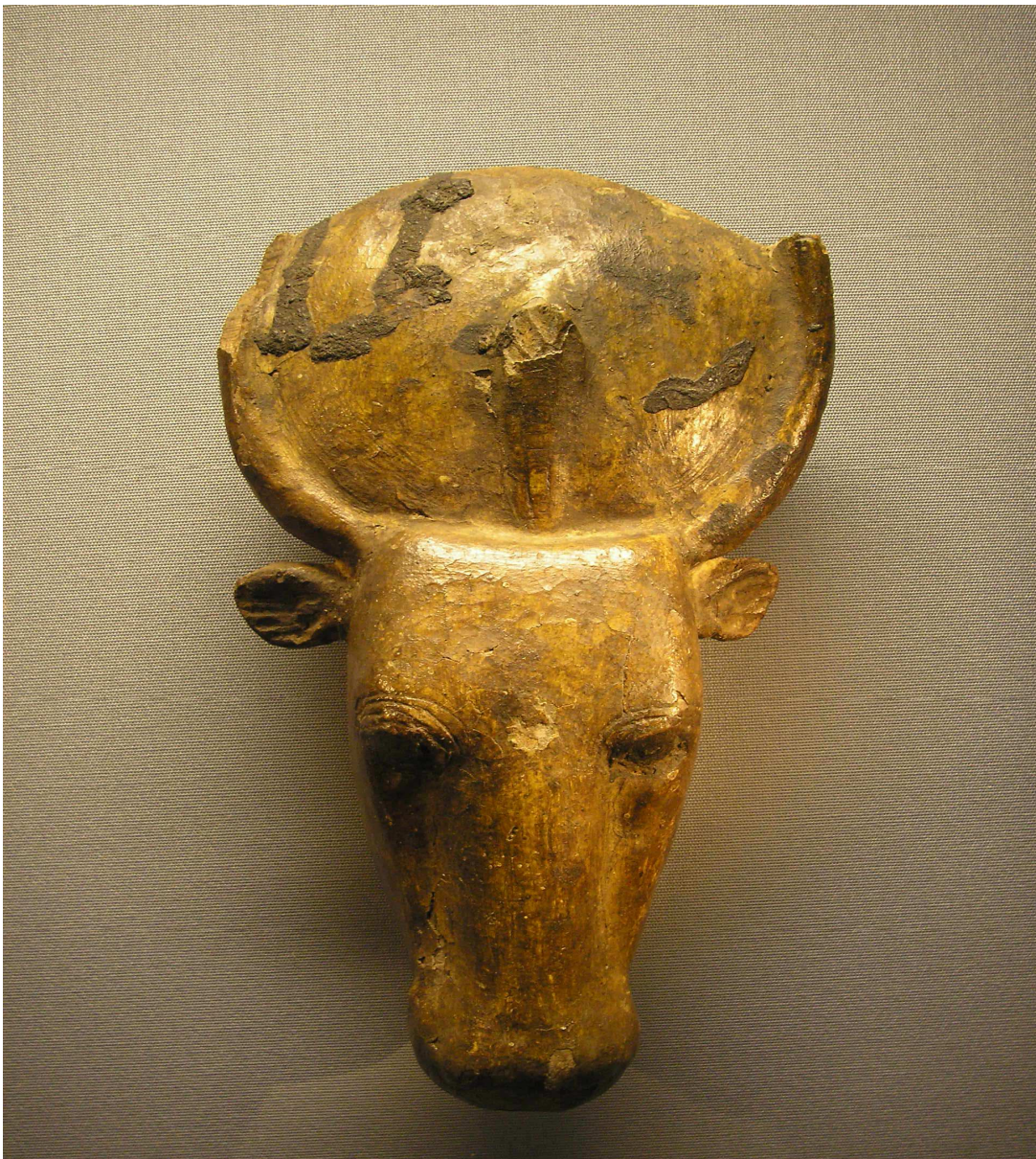
Le bœuf Apis au Kunsthistorisches Museum.