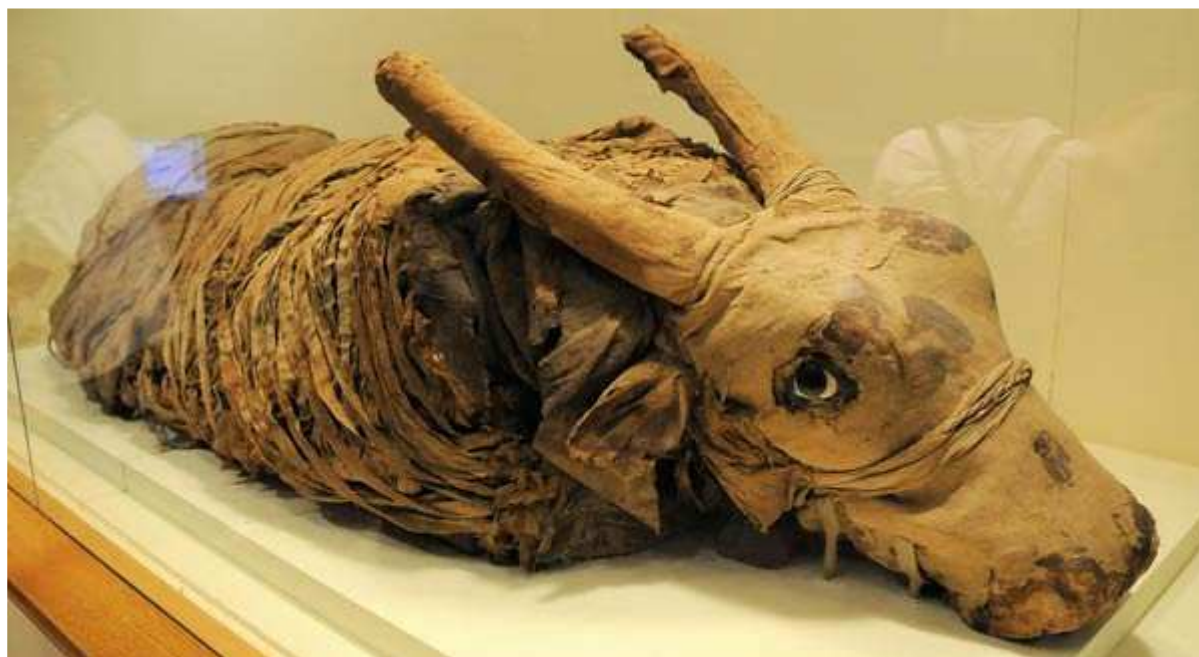
Taureau ou veau momifié. By Son of Groucho . Licence