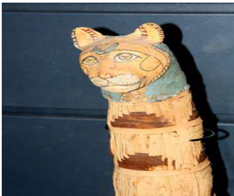
Momie de chat. AF 9461.