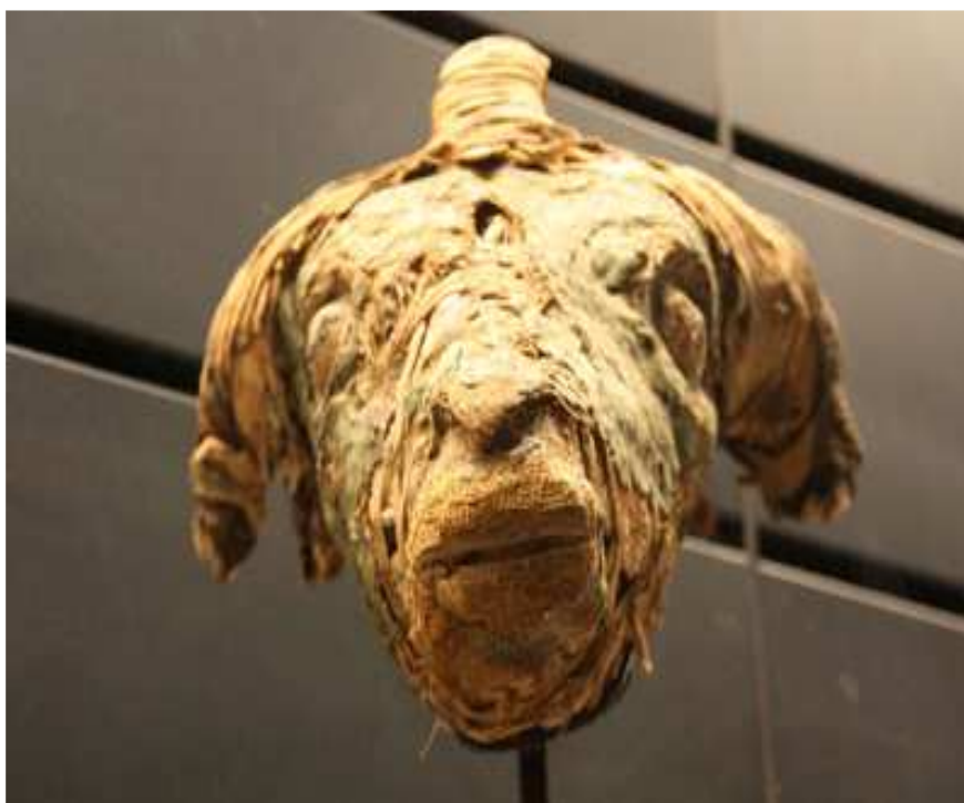
Tête de momie de bélier.