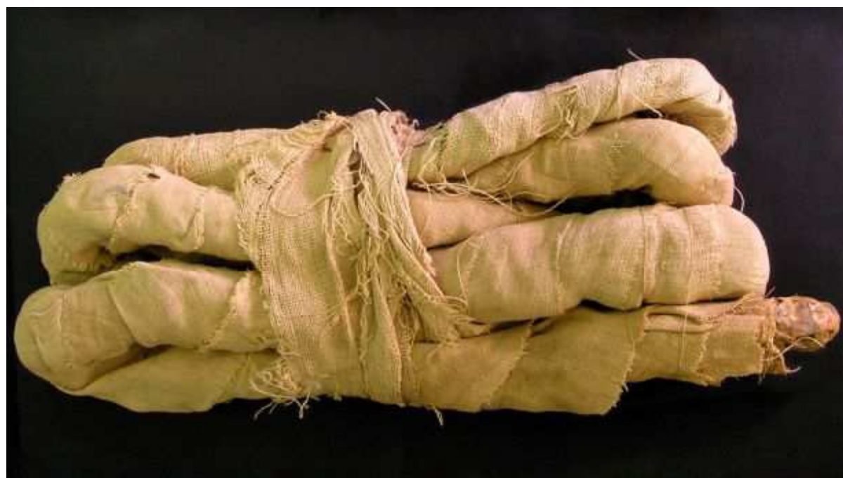
Momie de cobras : Naja sp. Cet exemple date probablement de 1 000 av.JC. Collector TS Henry, 1897.

Des momies de serpents auraient été trouvées dans les nécropoles thébaines ! Il s'agirait de serpents divinisés, nommés Pa-neb-ânk "les maîtres de la vie"