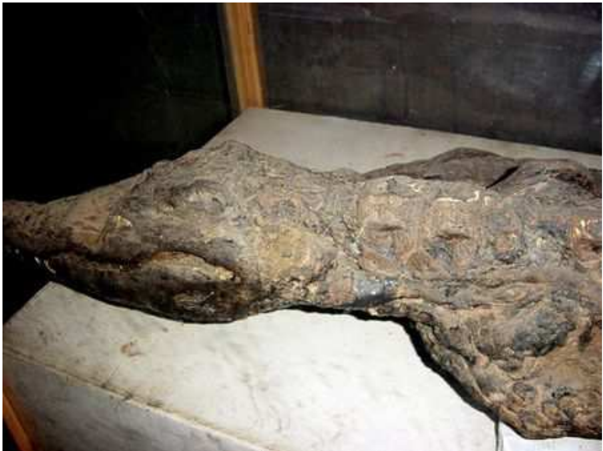
Momie de crocodile du Nil !