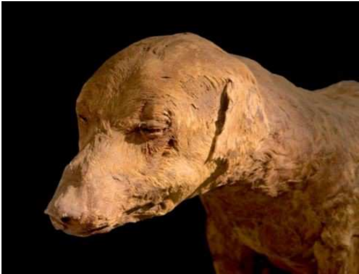
Momie de chien.