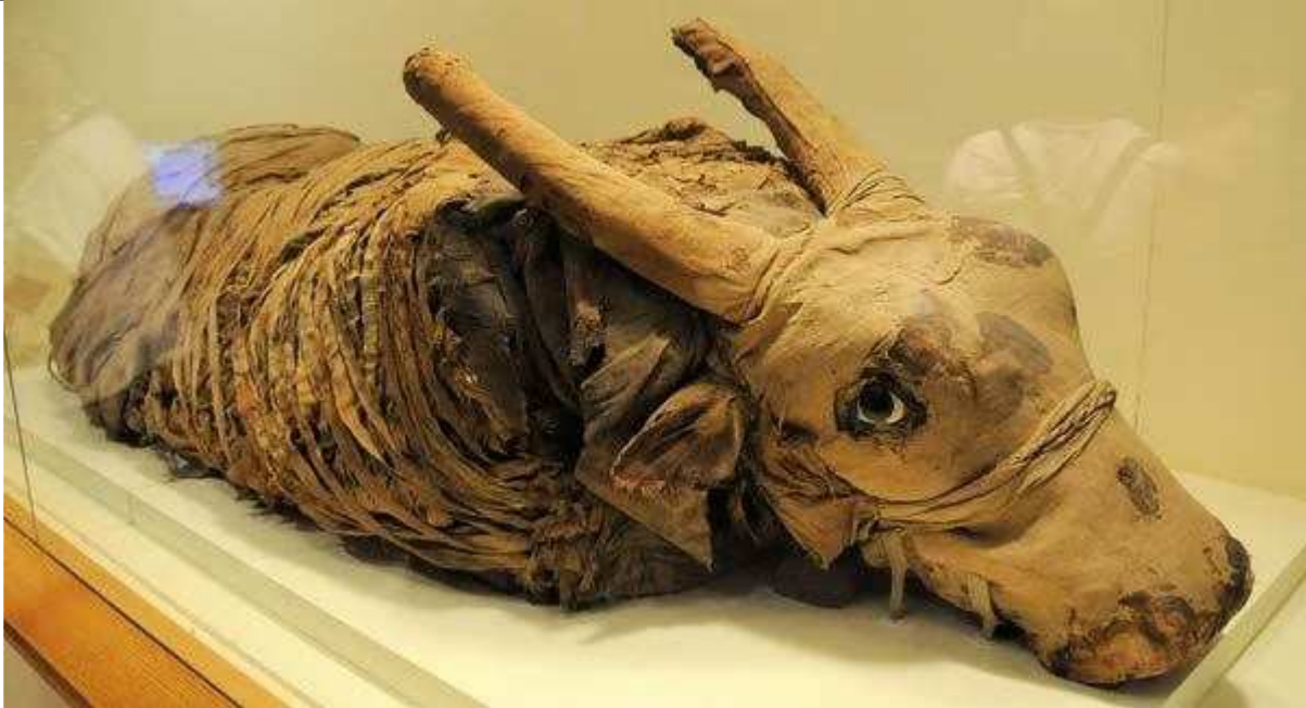
Taureau ou veau momifié. By Son of Groucho . Licence