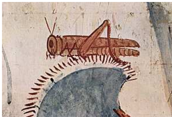
Peinture de la chambre funéraire de Horemheb ! 1 422 - 1 411 avant JC