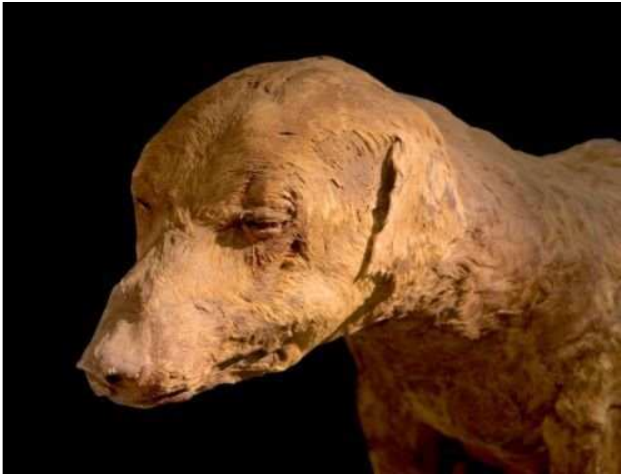
Momie de chien.