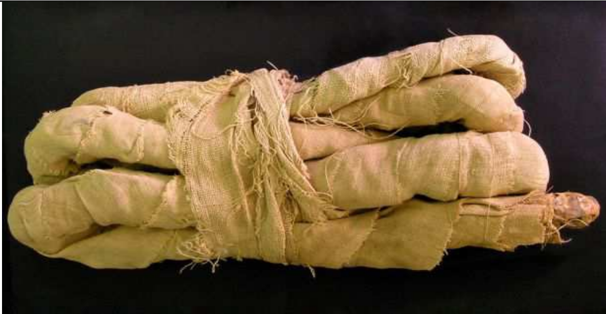
Momie de cobras : Naja sp. Cet exemple date probablement de 1 000 av.JC. Collector TS Henry, 1897.

Des momies de serpents auraient été trouvées dans les nécropoles thébaines ! Il s'agirait de serpents divinisés, nommés Pa-neb-ânk "les maîtres de la vie"