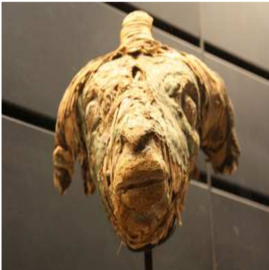
Tête de momie de bélier.