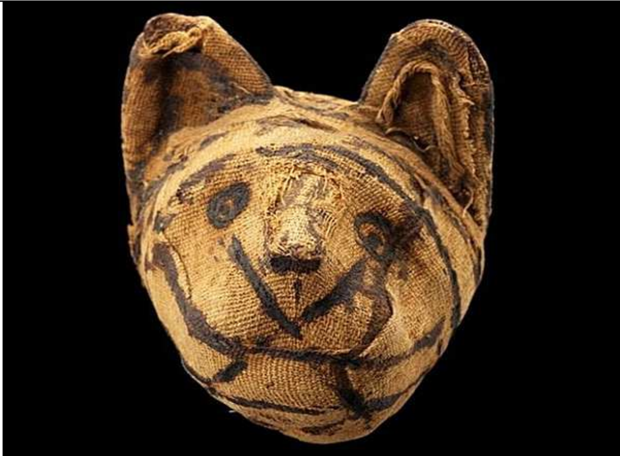
Head of mummified cat.