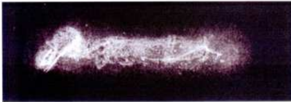
X-ray image of the mouse mummy

"La musaraigne a des mœurs nocturnes et souterraines, à l'abri de la lumière qu'elle redoute et sa mauvaise vue l'assignent au royaume de l'obscurité [...]