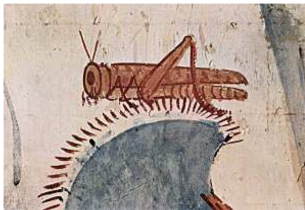
Peinture de la chambre funéraire de Horemheb ! 1 422 - 1 411 avant JC.