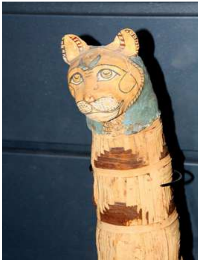
Momie de chat. AF 9461.