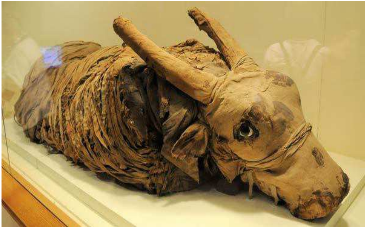
Taureau ou veau momifié.