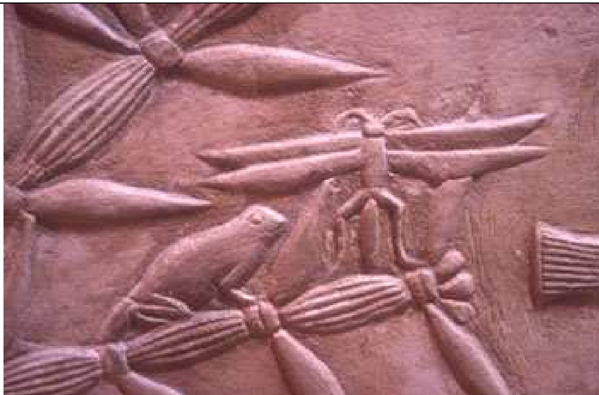
Une grenouille et la libellule.