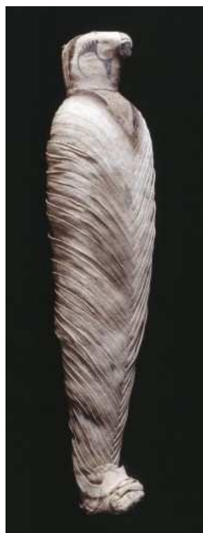
Momie d'un faucon...