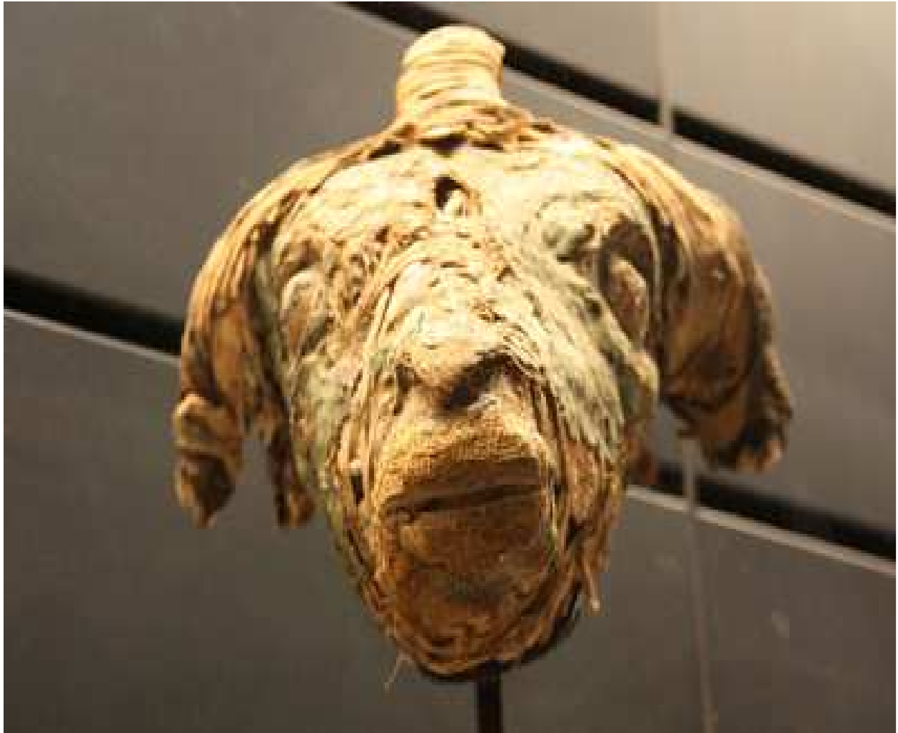
Tête de momie de bélier .