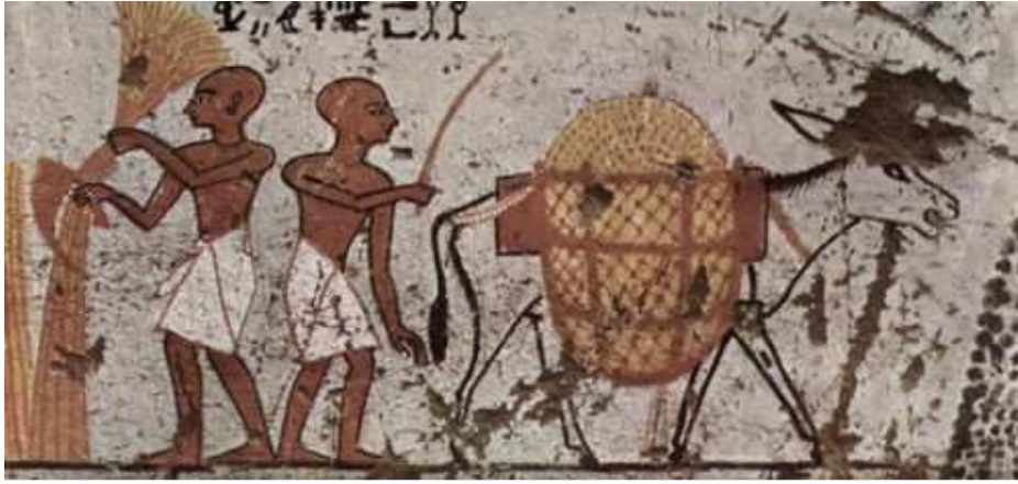
Hypogée de Paneshi...