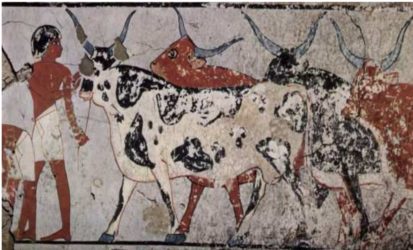
Peintre d'une chambre funéraire...