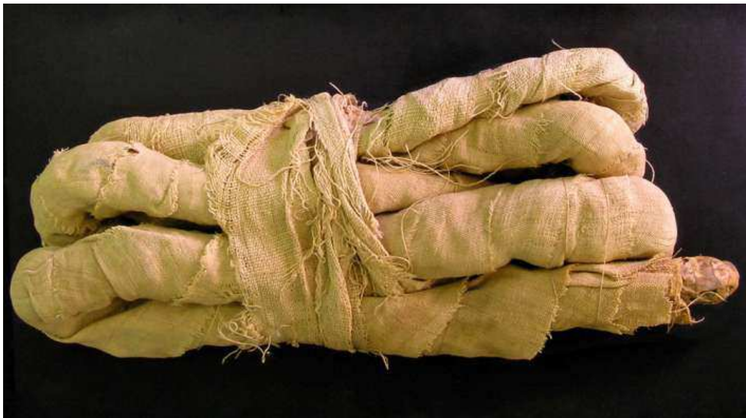
Momie de cobras : Naja sp.

Cet exemple date probablement de 1 000 av.JC.