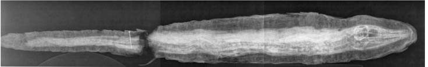
Photographie et radiographie d'une momie de bébé crocodile... Au Grand Curtius (inv. Égypte I-681b).