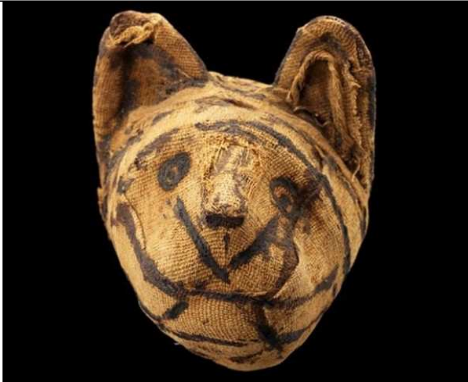
Head of mummified cat.