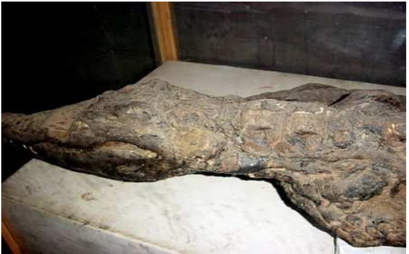
Momie de crocodile du Nil !