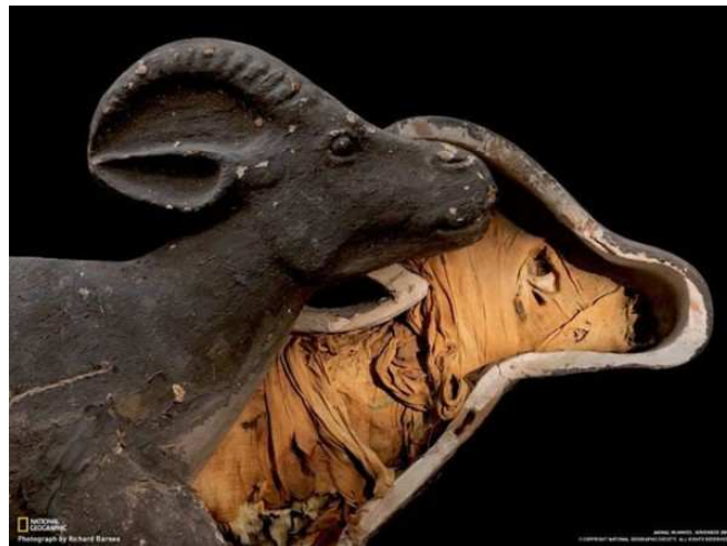
Environ 945 avant notre ère... © Richard Barnes Source