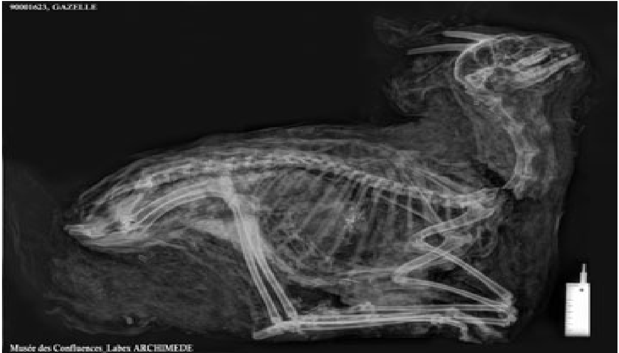
Radiographie d'une momie de gazelle . Radiographie © : Roger Lichtenberg.