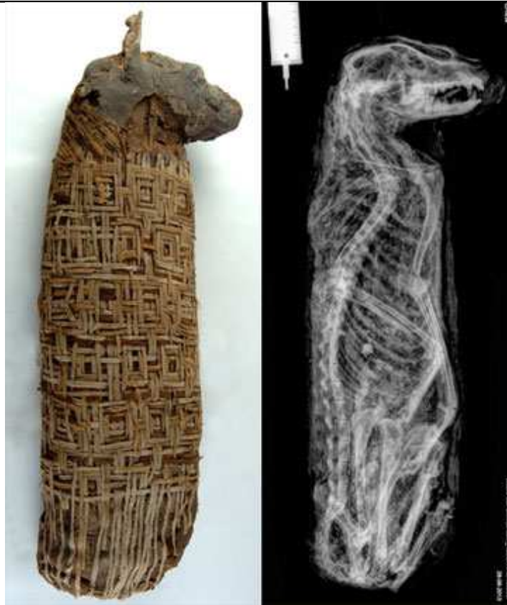
Momie de chien et sa radiographie.