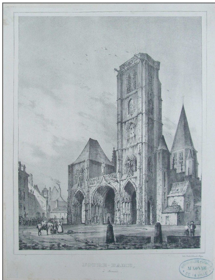
Auxonne, la Place de l'église au début du 19 ème siècle

A cette époque les danseurs de corde ou funambules dansent sur une épaisse corde de chanvre italien, improvisant des courses, des sauts, des figures acrobatiques. Ils sont très appréciés du public. Leur lieu de prédilection est la rue et surtout les foires.