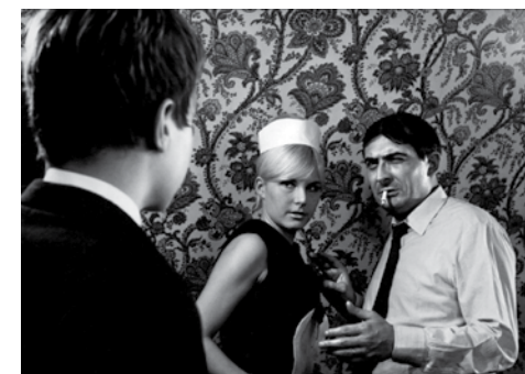
« Paris vu par... »