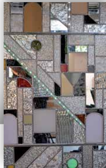
« La Cité », détail Serge Elphège

Réservation indispensable au 01 34 23 58 76