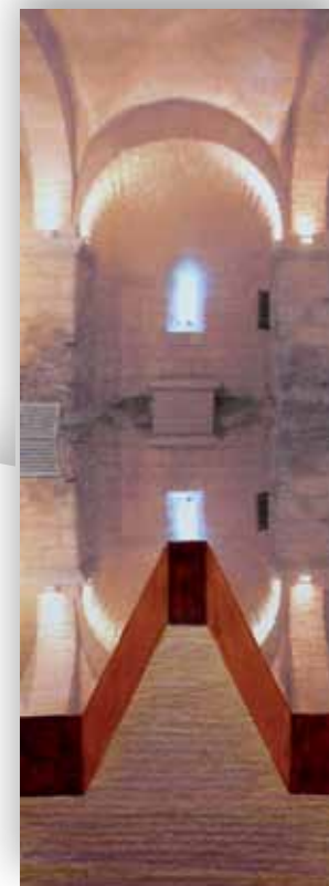
« Passage », projet Zsuzsa Farkas

sam. 19 > 14 h à 20 h 14 bis rue de Seine [Centre-Ville]