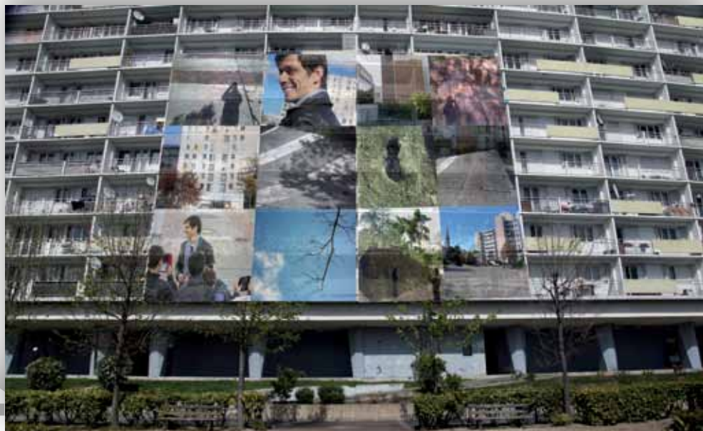
« Regards croisés » à la cité Champagne, montage Klaus Fruchtnis