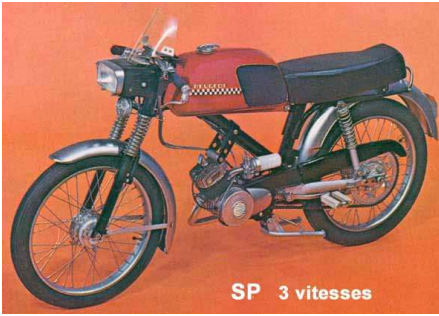
SP 3 vitesses

Le SP3 ressemble fortement au BB3 SP avec son guidon bracelet typé sport alors que le TS3 est la version tourisme avec un guidon relevé.