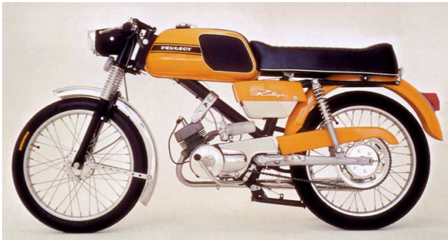
Le Rallye SPR avec sa belle couleur jaune et sa vraie pédale de frein arrière au pied.

En 1973 les SP3 / TS3 seront remplacés par 2 nouveaux modèles : les Rallye SPR et TSR . La décoration à damiers du réservoir est remplacée par une sobre bande noire ou