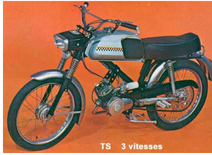
TS 3 vitesses

Au lancement les premiers modèles produits sont équipés de gardes boue avant et arrière peints en gris clair. Très rapidement ils seront remplacés par des modèles chromés. De même, les carters de chaîne vélo et moteur et le cache pignon de sortie de boîte auront droit à la même finition à partir de 1971.